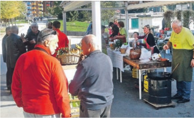
Predstavitev jedi je postala v Šaleku že tradicionalna. Krajanji pripravijo dobrote za sokrajane.