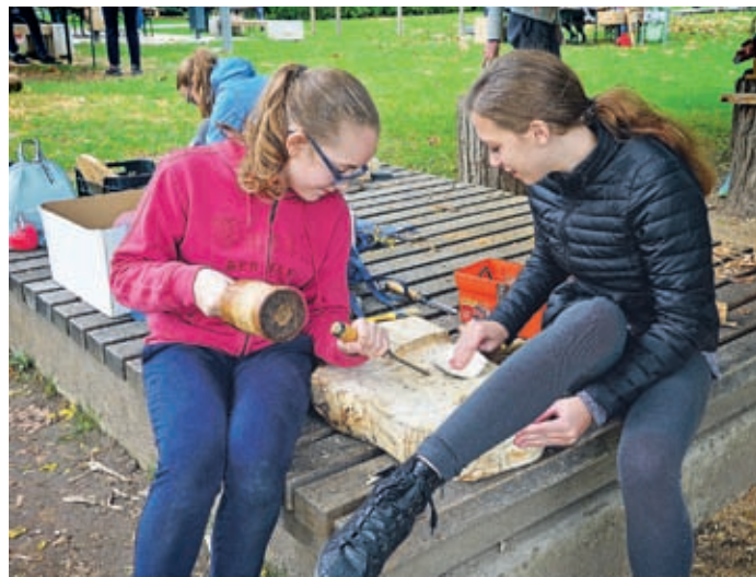
Ekipo OŠ Gorica se je odločila za klasično klesanje z dletom in kladivom. Žuljev je bilo precej, a jih niso motili.

no šolo. Ko so tam zgradili nov dom krajanov, smo se tja vrnili. Likovni pedagogi in otroci so si želeli, da bi več ljudi videlo in vedelo, kaj ustvarjajo v času kolonije, zato smo se preselili v Šoštanj, kjer smo ustvarjali v okolici vile Mayer. Ko tu ni bilo več možno izvesti kolonije, ker so nekdanjo šolo Bibe Roecka podrli, smo se prestavili v vilo Mojca, od tam pa v naš novi dom, vilo Rožle.« Ugotovili so, da ustvarjanje v središču mesta privabi veliko obiskovalcev, kar velja tudi za Sončni park, kjer se ustavijo mnogi sprehajalci in občuduje-