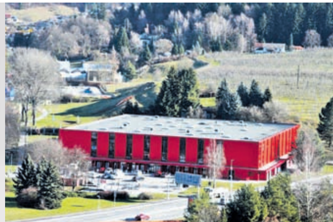
Rdeča dvorana Velenje

- 7. oktobra 1972 je v Pesju začela obratovati nova naprava velenjskega premogovnika za izvoz premoga iz jame; - od 5. do 7. oktobra 1972 je bilo v Velenju posvetovanje slovenskih knjižničarjev; - 7. oktobra 1976 so v Velenju uradno predali svojemu name-nu Dom za ostarele občane; - 7. oktobra 1977 se je rodil vrhunski jazz glasbenik Jure Pukl iz Velenja; - 7. oktobra 1983 so odprli podhod pod Kidričevo cesto med današnjo Knjižnico Velenje in pošto; letos so ga obnovili; - v noči na 8. oktober leta 1941 so borci 1. štajerskega bataljona napadli mesto Šoštanj; to je bil prvi partizanski napad na mesto v Sloveniji in ena prvih večjih partizanskih akcij v Sloveniji v tem letu; zaradi pomembnosti napada so si ta dogodek