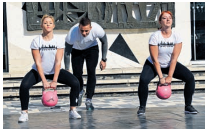
Pestro je bilo tudi na priložnostnem odru. Mnogi so občudovali spretnost in fizično pripravljenost trenerjev in obiskovalcev velenjskega fitness centra.