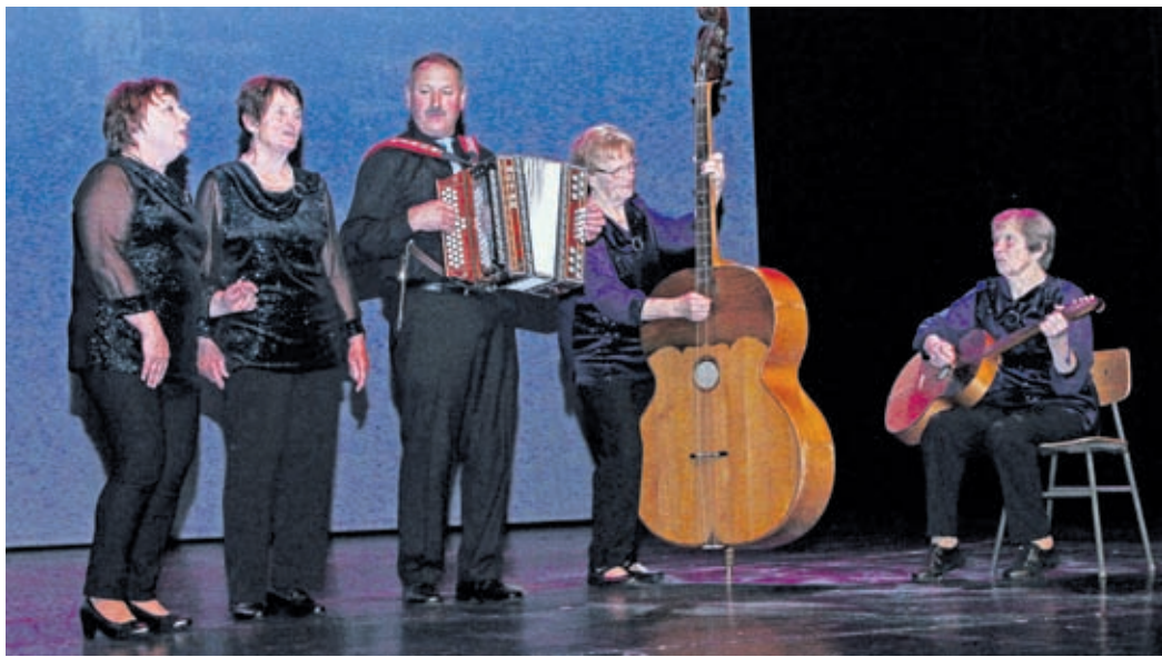
Vesele babice z Zdravkom iz DU Šmartno ob Paki so navdušile v CD v Ljubljani

Prvi dan festivala na 9. večeru pesmi in plesa so se med dvanajstimi skupinami predstavile Babice izpod Gore Oljke, pevci šoštanjskih upokojencev pa na 42. reviji pevskih zborov, ki je bil na sporedu naslednji dan. Lep spre-