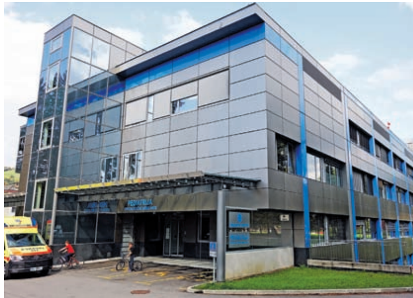
Poleg urgence in pediatrije bolnišnica potrebuje tudi nov kirurški blok

Ta mesec bodo v bolnišnici nastopili mandat novi člani sveta zavoda, ki se bodo na konstitutivni seji predvidoma sešli 24. oktobra. Takrat naj bi bil znan tudi njegov novi predsednik, saj