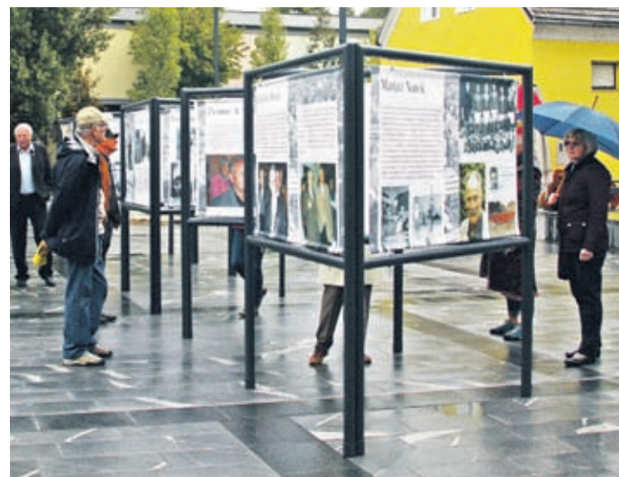
Vse do pomladi si lahko na Trgu svobode ogledate razstavo znanih šoštanjskih obrazov. V Muzeju Velenje, kjer so jo pripravili, bodo pripravili tudi nadaljevanje, saj je ljudi, ki si to zaslužijo, v Šoštanju veliko.

Šoštanjska enota Muzeja Velenje letos deluje že osmo leto. V načrtu imajo, da muzej usnjarstva v naslednjih letih razširijo,