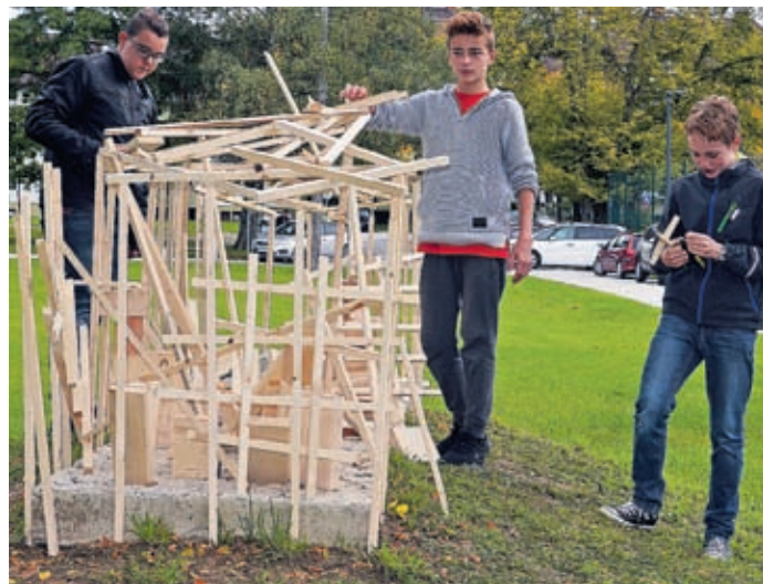
Ekipo OŠ Šalek je s to inštalacijo hotela poudariti, da človek lahko ogradí človeka, ne more pa ograditi njegovih misli.