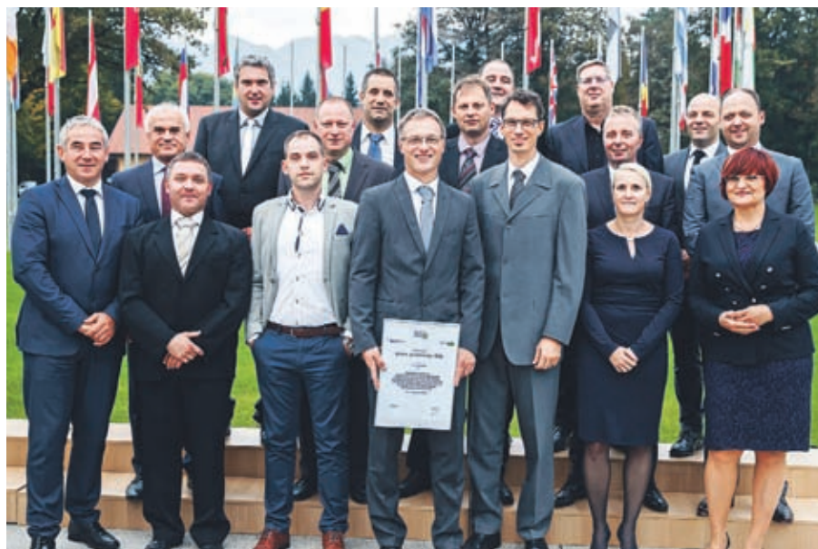
... in podjetja BSH Hišni aparati Nazarje