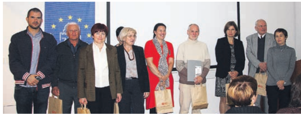
Predavateljem iz vse Slovenije so na simpoziju predstavili veliko zanimivih tem, povezanih z usnjarstvom.