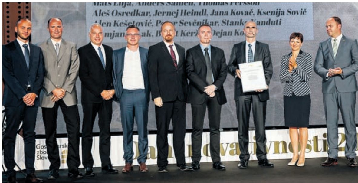
Inovatorji Skupine Gorenje ...

nagradimo,« pravijo v podjetju. K razvoju procesov, izdelkov prispevajo približno 10 odstotkov predloženih predlogov, nekatere nato razvijejo tudi v patentne. Teh prijavijo na leto blizu 30, kar uvršča BSH Hišne aparate Nazarje v sam vrh v državi.