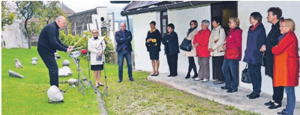
Razstavo kiparskih del v kamnu, ki so jih ustvarili ljubiteljski kiparji, so odprli pred gradom na travniku, kjer stoji glavnina del.

veliko težji material, kamen. Prve delavnice so potekale v zaščitenem Kuclerjevem kamnolomu pri Vrhniku, zadnja leta pa delajo v Mineralovem kamnolomu, kjer imajo boljše pogoje za delo, saj potrebujejo tudi elektriko za kotne brusilke. »Orodje tečajnikov in njihovo razumevanje oblike je po dveh desetletjih zelo napredovalo. Mnogi se vračajo, saj ra-