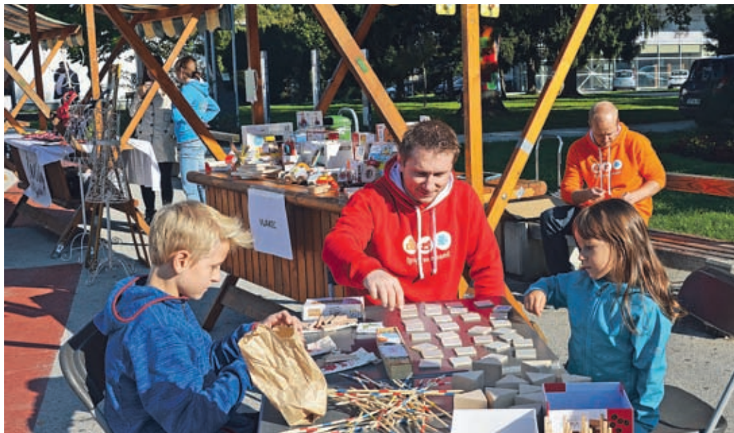
Podjetniki so se predstavljali različno, mnogi zelo izvirno. Pripravili so različna presenečenja in majhna darila za obiskovalce.

Mestna občina Velenje jim je predstavitev na osrednjem mestnem trgu omogočila brezplačno – Podelili nagrade za najlepše urejene lokale v središču mesta