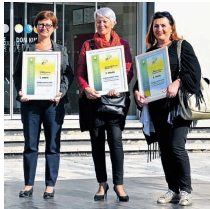
Dobitniki nagrad za najlepše urejene prodajne lokale v centru mesta so bili veseli tako bogatih nagrad kot pozornosti, ki so je bili deležni.