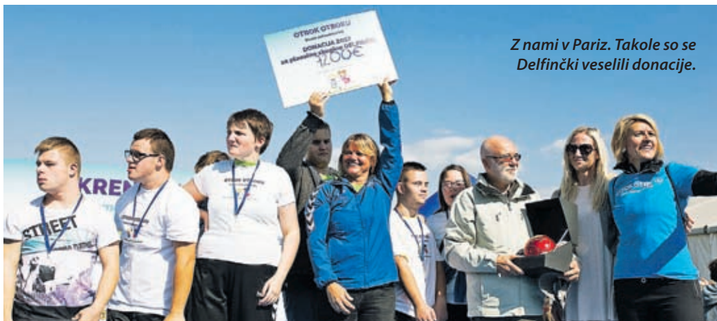
Z nami v Pariz. Takole so se Delfinčki veselili donacije.