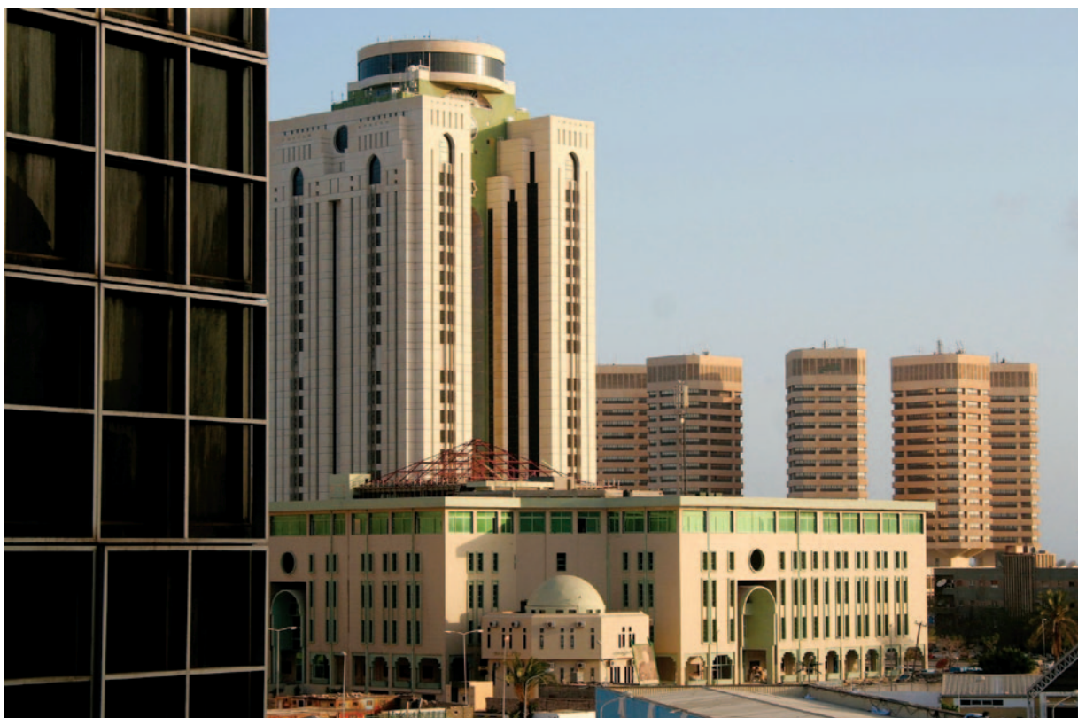
Slika 3: Z odkritjem nafte in zaslužki od njene prodaje je milijonski Tripolis prerasel v sodobno prestolnico.

Migranti, ki prihajajo z območja zahodne in tudi osrednje Afrike, vstopajo v Libijo večinoma prek Nigra, tisti iz vzhodne Afrike, med njimi tudi z Afriškega roga, pa vstopajo vanjo tudi prek Egipta in Sudana. V grobem gledano so ti migranti iz afriških držav severno od ekvatorja. Poti nedovoljenih migrantov od izvornih držav do Libije oziroma naprej do sredozemskih članic EU so v večini primerov postopne, z vmesnimi postanki. Trajajo od nekaj tednov do nekaj mesecev, včasih tudi več let. Odvisne so od finančnih sredstev migrantov, ki se običajno v ta namen zadolžijo že na začetku poti v domačih krajih. Ker se zaradi brezpravnega položaja hitro ujamejo v mreže tihotapcev ljudi, pogosto pa z njimi nehumano ravna-