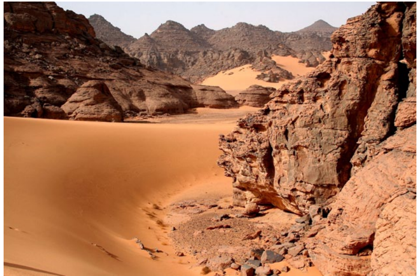
Slika 5: Blizu mesta Gat na jugozahodu Libije se vzpenja gorovje Akakus.

K padcu el Gadafija je nedvomno pripomogla tudi Natova vojaška intervencija v zgodnji fazi upora proti režimu. Že v tistem času so se proti Gadafijevim silam borile tri večje milice. Orožja iz starih Gadafijevih arzenalov je bilo povsod v izobilju, kar je pomembno prispevalo k družbeno-politični nestabilnosti v širši saharsko-sahelski regiji, predvsem na začetek konflikta v Maliju leta 2012. Čeprav je bil v Libiji avgusta 2011