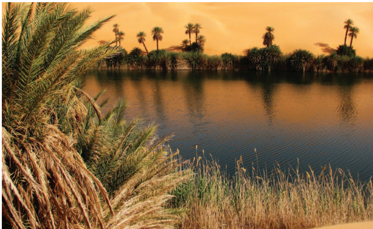
Slika 1: Sipine in slano jezero Um el Ma, ki je med večjimi Ubarijskimi jezери, ležijo ob migracijski poti.

Do začetka šestdesetih let 20. stoletja so se osamosvojile še vse sosednje države z območja severne Afrike in saharsko-sahelskega pasu. Vzpostavitev državnih meja, ki se v Afriki skorajda niso ozirale na etnične, jezikovne in druge značilnosti posameznih regij, praviloma ni vplivala na prekinitev starih čezsaharskih migracijskih in trgovskih poti. Te že od antike dalje povezujejo podsaharsko in sredozemsko Afriko, predvsem s karavanami, usmerjenimi čez oaze oziroma posamezna mesta na strateško pomembnih točkah. Tisoči kilometrov libijske meje v Sahari so ostali »porozni« in dejansko še vnaprej prehodni za nomadska in polnomadska ljudstva, kakršno so denimo Tuaregi, pozneje pa so prekosaharske poti začeli uporabljati tudi drugi, sodobni migranti (Pirc 2010, 87–89; Kasule 1998, 42, 46).