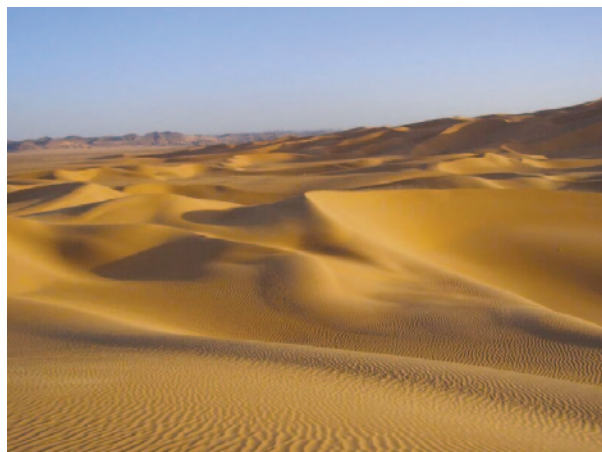
Slika 2a: Puščava zahodno od naselja Alawenat v pokrajini Fezan na jugozahodu Libije, severno od mesta Gat, pomembnega križišča za migrante.