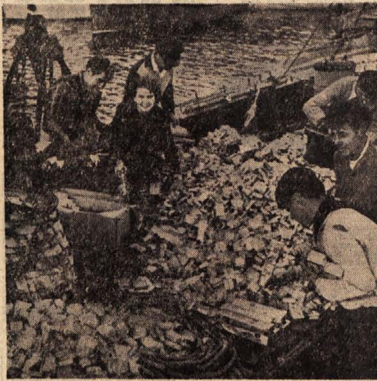
Potem ko je dobila posebna francoska carinska brigada Forresterovi enakovredno opremo in sodobna tehnična sredstva, so morali njegovi tihotapci večkrat v naglici zapustiti z zavojčki ameriških cigaret do vrha polne barke. Posnetek kaže veselo francoske ribiče v Saint-Mandrierju, kjer so našli nenavadne »ribice« ameriškega izvora

Ker je torej v jamah sorazmerno malo hrane in ker se morajo podzemeljske vodne živali pogosto prebijati skozi ozke prehode, so zelo majhne; tako n. pr. velja 5 do 6 cm dolga ribica v jamskih razmerah že za precej veliko. Jamski kuščar je včasih dolg tudi do 12 cm, vedno pa je vitek in prožen. Ker je v jamah stalna temperatura, v njih živeča bitja ne potrebujejo dlakaste ali pernatne zaščite, ki bi zadrževale izparevanje njihovih organizmov. Tam je brez pomena tudi barva, zato se je pri jamskih živalih malone povsem izgubila. Hkrati s kožnimi pigmenti so sčasoma izgubile tudi oči, namesto njih pa so se razvila druga čutila. Zanimivo je na primer, da se ribe iste vrste, ki živijo v različnih jamskih razmerah, občutno razlikujejo med seboj. Bistvenih razlik seveda ni, po natančni podobnosti istih rib v različnih jamah pa je mogoče sklepati o podzemeljski povezavi med njimi.