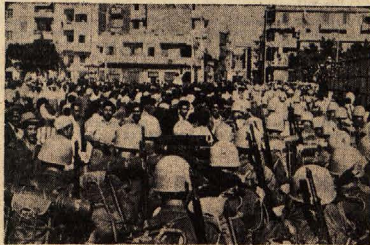
Mednarodne varnostne sile OZN prihajajo v Port Said

Seja je bila nato zaključena in sklicana prihodnja za jutri popoldne.