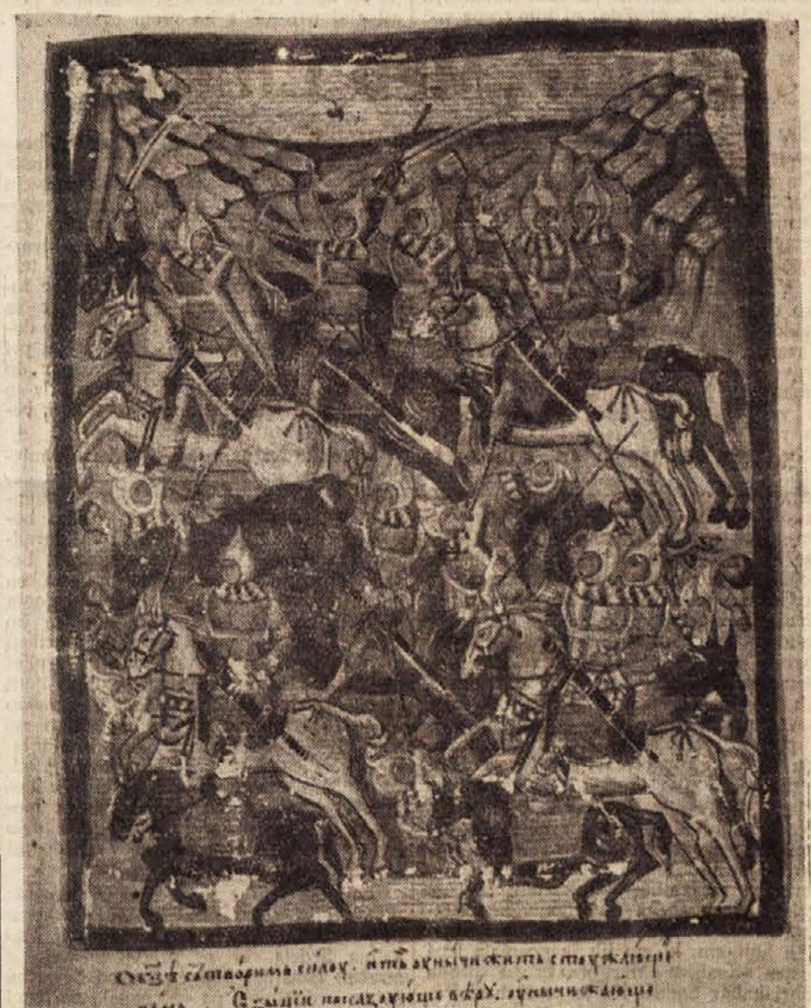
Jugoslovanska srednjeveška umetnost: beogradska kopija münchenskega psalterja.

Razen svoje visoke umetniške vrednosti bodo naše freske podale tudi sliko o naših razviti materialni kulturi v srednjem veku. Dela iz srbskega fresko-slikarstva, ki ima poleg bizantinskih elementov predvsem izvorno obeležje, bodo pokazala nadmoč umetniškega izraza naših srednjeveških slikarjev nad mnogimi de-li, ki so v tej dobi nastala na zapadu.