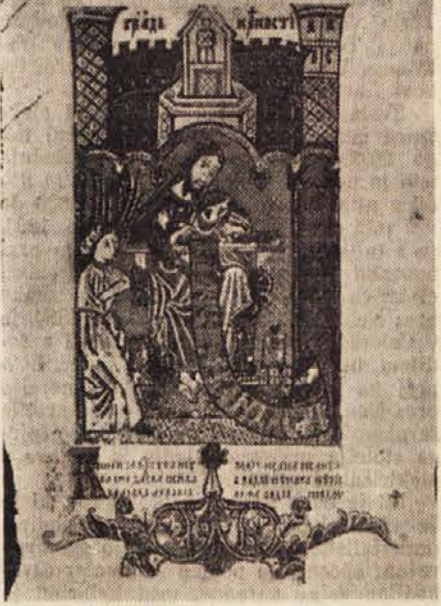
Hvalov rokopis, miniatura ilustracija

Razstava bi morala trajati do 1. marca, vendar pa bo na zahtevo francoskih u-metnikov trajala tri mesece. Po pariški razstavi bodo naše freske in dela naše srednjeveške arhitekture razstavljene tu-di v Londonu. Ta velika kulturna mani-festacija je vzbudila zanimanje tudi v ZDA, kjer bodo še letos priredili kar tri razstave, in sicer v New Yorku, Wa-shingtonu in Chicagu.