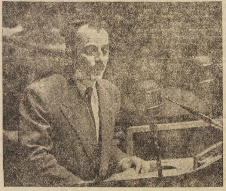
Koča Popović na govorniški tribuni v Generalni skupščini OZN

Po navdušenju, ki je nastalo po sovjetski-privolitev v francosko-britanski predlog, je prišlo deloma do razočaranja med razpravo, pa tudi do začasnega poslabšanja vzdušja, ker ni bil izpolnjen up, da bodo hitro dosegli sporazum. Toda noben sporazum na hitro roko ni možen. Razlike v stališčih so še tako globoke, da zahtevajo še znatno izboljšanje splošnega vzdušja zaupanja, v katerem bi lahko razlike premostili. Vsekakor pomenijo dosedanja uspešni korak naprej v utrditvi miru na svetu. Za ZN pomenijo prvi veliki korak k obnovi ugleda in k nadaljnji krepitvi njihove vloge v mednarodnih odnosih.