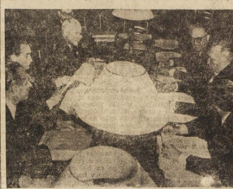
Pariška konferenca zunanjih ministrov zahodnih okupacijskih sil in Zahodne Nemčije

Prve sporazume so podpisali v vprašanja so bila po mnenju francoskem zunanjem ministru ob 15.20. Najprej so podpisali francosko-zahodnonemški sporazum o Posarju, zatem pa doku-