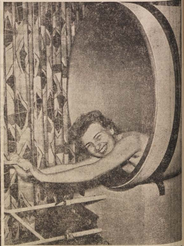
V Švicel so izdelali posebno kad, ki naj z nekakšnimi tresilji pospešuje hujšanje. Kad se vrti, obložena notranja stena pa masira človeka, ki se zaupa tej najnovejši šuševalni kurl