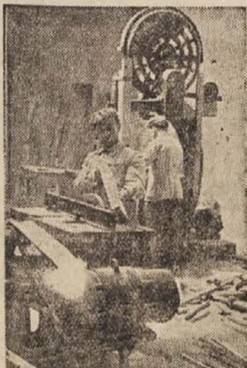
Pri tračni žagi