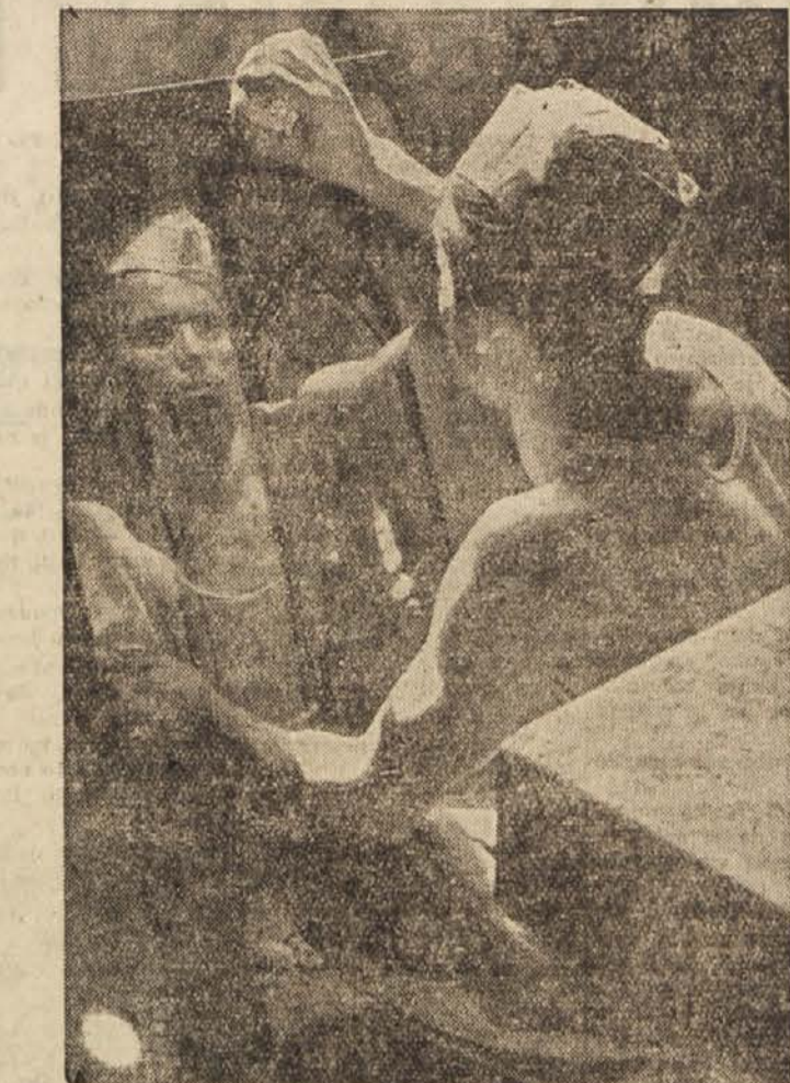
Mizar lošči posteljno stranico

Pri vsem tem je treba vedeti, da delajo v razmeroma zelo slabih delovnih pogojih. Zato se že dalj časa ukvarjajo z načrti, ki se že začenjajo uresničevati. V Dutovljah, bodočem središču podjetja, bodo zgradili moderno tovarno. Doslej dela v vseh treh obratih 110 delavcev, dutovljska tovarna pa bo sama zaposlila 200 delavcev in, če bodo sčasoma delali v dveh izmenah, celo 400 delavcev. Ni treba posebej omenjati, kako je to