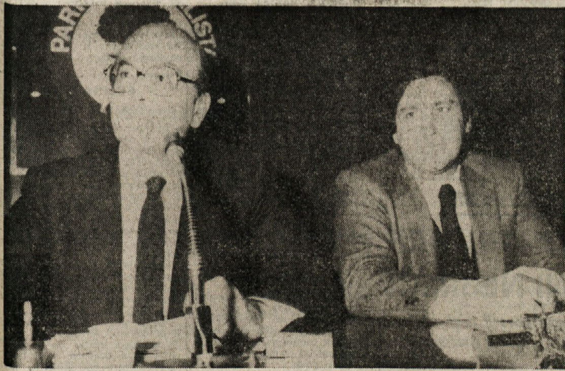
Craxi in Signorile pred začetkom večerajšnje seje vodstva PSI

Kritike na račun vodenja stranke in politične strategije, ki je za strankino levico dvoumna