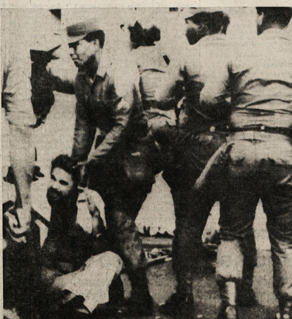
Panamski študentje s protestnimi manifestacijami zahtevajo šahov izgon. Vlada in policija pa sta drugo