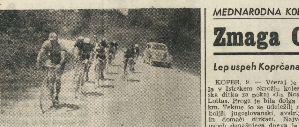
Posnetek z nedeljske zanimive dirke v Istri za pokal "La Nostra Lotta"