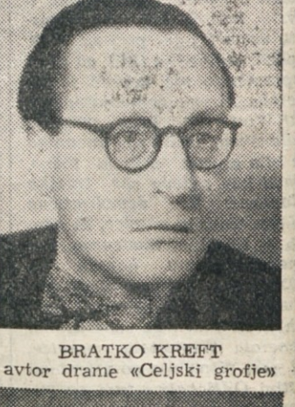
BRATKO KREFT avtor drame Celjski grofje