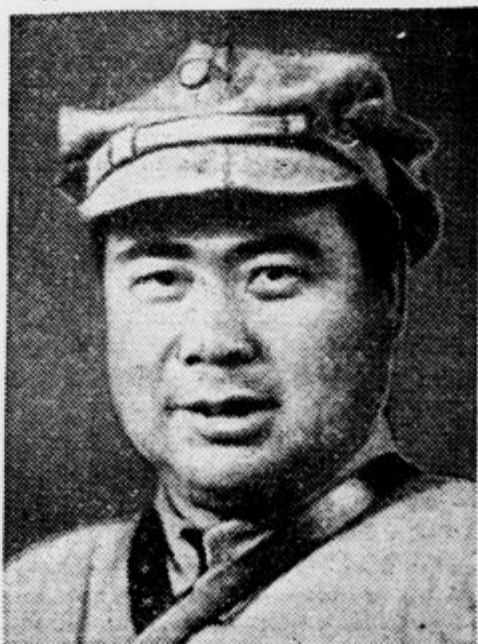
bivši kitajski vojni minister, ki je znan nasprotnik Japoncev, se je začel spet udeleževati v politiki. Ta čas se pogaja s kitajskim diktatorjem, maršalom Čangkajšekom.

Taft ni razumel. »Kaj pa boste s tem?« je vprašal. »O«, je odvrnil ribič, »stvar sem natančno premislil. Ena hlačnica bi dala lepo obleko za mojo hčerko, iz druge hlačnice bi dal končno napraviti novo obleko za svojega Jeana. In razen tega potrebujem novo jadro za svojo ladjo. Zadnji del hlač bi za to baš zadostoval... Če vam ni nič od tega, mister prezident — meni bi bilo zelo pomagano!«