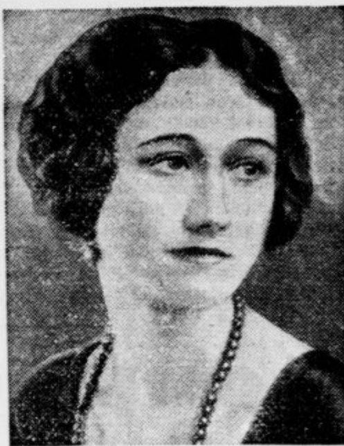
Ga. Wallis Simpsonova

Na Angleškem zbujata ta čas veliko pozornost ločitev drugega zakona ge. Simpsonove, ki ima na dvoru kralja Edvarda