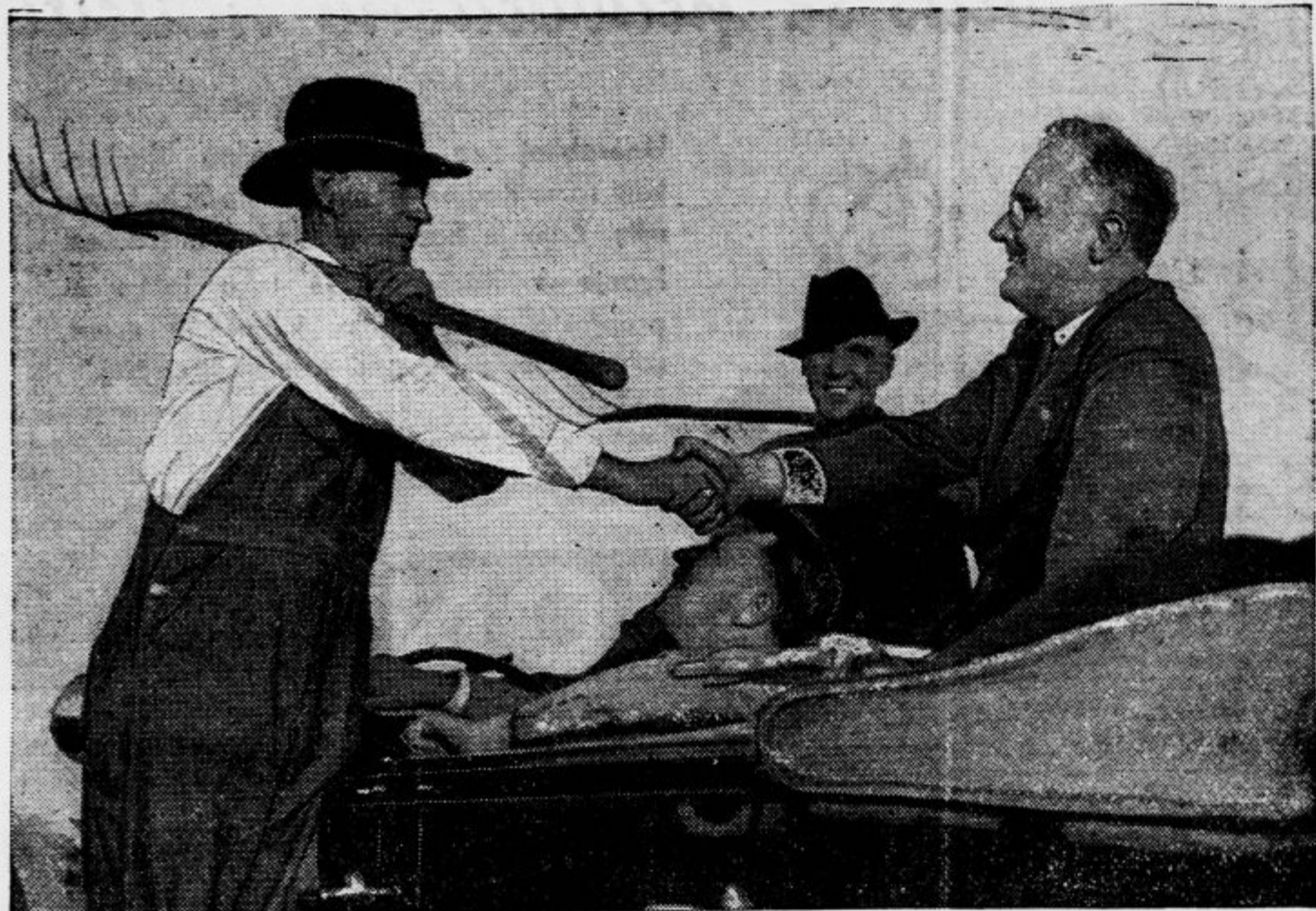
Ko je zmagal nad svojim glavnim nasprotnikom Landonom v 44 državah proti 4! Zmagal je s svojo priljubljenostjo med širokimi ljudskimi plastmi!