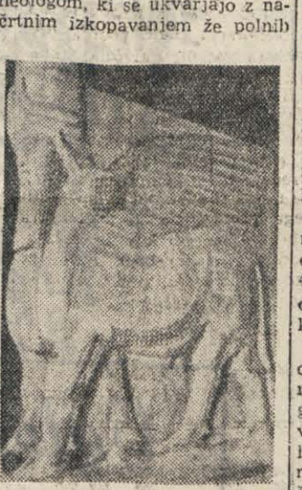
Vojne uničile številne dragocene umetnine starega veka

po načrto bo luka Bar ena in drugim državam, v katerih najpomembnejši luka ob jugopristajajo jugoslovske ladje, slovaški jadranski obali.