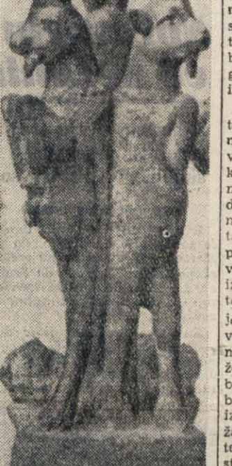
V pariškem muzeju Louvre hranijo tudi ta čudoviti kipci, ki ga sestavljajo trije kozorog. Kipec je iz brona in kozorog imajo gobec prevlečen z zlatom.