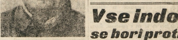
VODITEVJ KITAJSKE KP MAO CE TUNG

Vse drugače je položaj na osvobodeni Kitajski, kjer se začena novo življenje. Mukden, največje industrijsko središče severno-vzhodno Kitajske, ki šteje 1.800.000 prebivalcev, je podlrgi mesec po osvoboditvi popolnoma menjal svoje lice. Ceste so natpane s tovornimi avtomobili, ki vozijo žito, druga živila in premog. S pomočjo ljudske vlade je bilo tretji teden po osvoboditvi odprti 59 šol s 10.000 študenti.