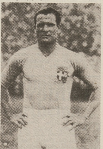
Luisito Monti, ki je v Italijo leta 1934 osvojil naslov svetovnega prvaka. Monti je leta 1930 igral za Argentino.

Prvenstvo se je odvijalo od 27. maja do 10. junija. Državne železnice so nudile 70-odstotni popust tistim, ki so potovali na tekme. V organizacijo je bil vpleten tudi Trst, ki je 27. maja gostil tekmo osmine finala med Češkoslovaško in Romunijo. Obe ekipi sta prišli v Trst nekaj dni pred tekmo in bili deležni izredne pozornosti. Romuni so se nastanili v hotelu Regina, prej Narodnem domu, ka-