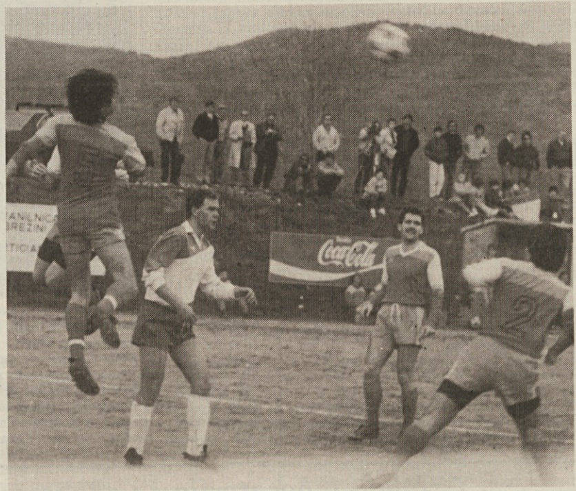
Z zmago proti Bregu (na sliki) si je proseško Primorje zaslužno priborilo napredovanje v 2. amatersko ligo. Na Proseku se seveda še sedaj veselijo tega uspeha