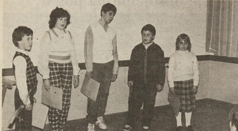
Gročanski otroci so recitali nekaj partizanskih pesmi

Na predvečer prvomajskega praznika so bile pri nas, poleg prireditelj, povezanih s postavljanjem mlajev, tudi proslave in krajše spominke svečanosti, posvečene spominu tistih, ki so dali v boju za mir in svobodo, svoje življenje.