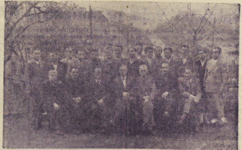
Skupina drugega višjega nor mirskega tečaja v Trbovljah

V dneh od 27. do 30. marca so se tečajniki udeležili ekskurzije, ki jo je dovolilo ministrtvo rudarstva LRS.