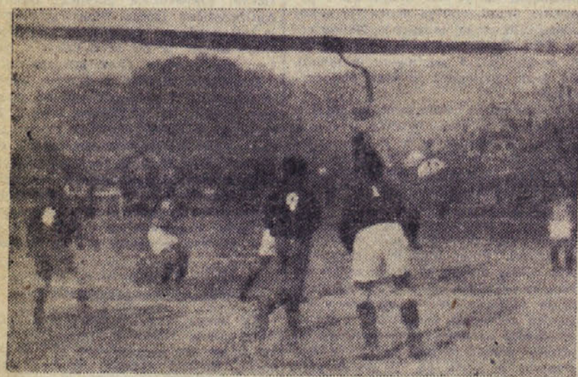
Moment iz nogometne tekme Rudar : Radnički

za štiriurno popoldansko zaposlitev — sprejme podružnica »Slovenskega poročevalca« Trbovlje. — Lep zaslužek.