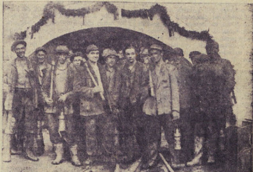
Brigada Petka Alojza po končanem delu pred rovom vzhodnega obrata

V začetku tega leta so se vršili občni zbori sindikalnih pododborov na rudniku Trbovlje, kakor tudi občni zbor rudarske sindikalne podružnice same. Na teh zborovanjih so ti sindikalni pododbori ter posamezni rudarji in proizvodne brigade prevzeli letne obveze, in sicer: da bodo po svojem delovnem času nakopali obljubljenostevalo ton premoga. Te obveze so se v mesecih januar, februar, marec vsakodnevno, pa tudi ob nedeljah častno iz-