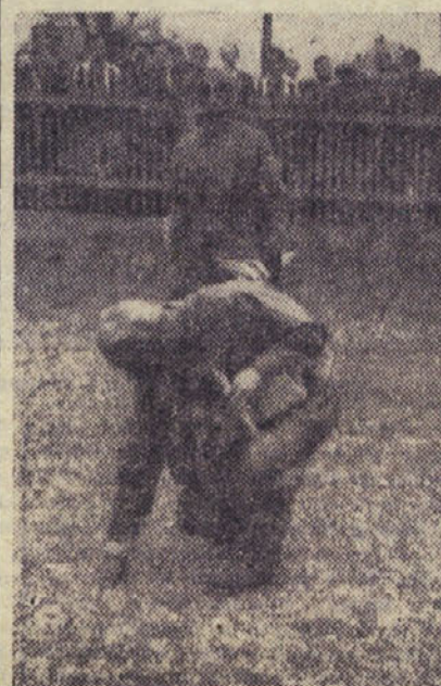
Oddeljenje protikemijske ekipe raziskuje zastrupljeni prostor

stajo pred Gasilskim domom. Tu so ponesrečenca oživljali z aparatom in umetnim dihanjem. Tukaj je kurir prinesel poročilo, da se je ves zastrup-