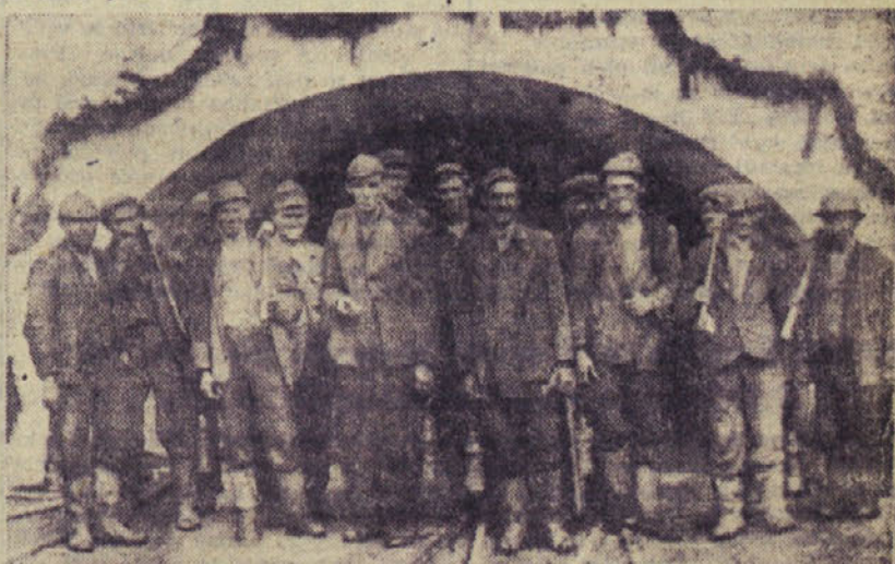
Brigadir Ovnika Poldeta s svojo brigado po zaključku naporenega dela v jami

ob zaključku tretjega leta petletke tudi visoko prekoračene.