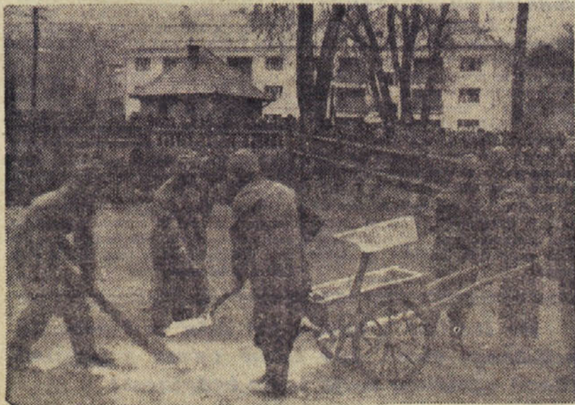
Vod protikemijske ekipe degazira zastrupljeni prostor

Proglasam za neveljavne ukradene živilske nakaznice za mesec marec: 1 jamsko, 1 navadno, 1 mladina 2 na ime Bec. 2 živilski nakaznici mojih staršev na ime Levičar 1 TDB in 1 navadno; februarke živilske nakaznice, na katerih je bil še odrezek za milo, v istem številu zgoraj navedenih, plus 1 na ime Levičar Alojz, 60 industrijskih točk in 3 odrezke za popravo čevljev. — Bec Jože, Loke 444 Trbovlje.