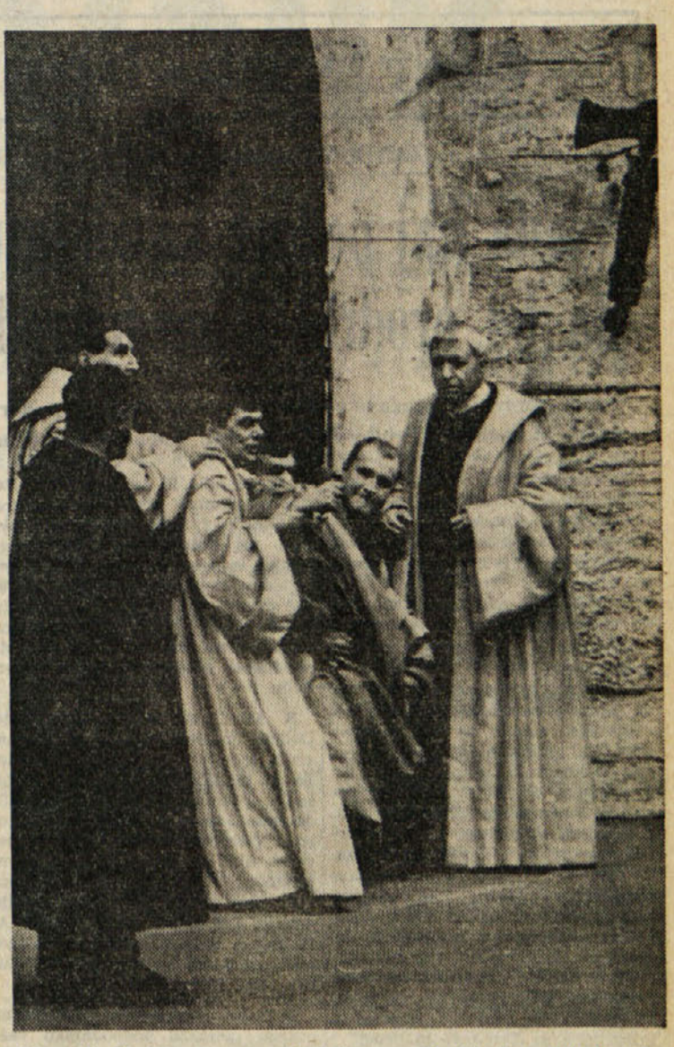
Prizor iz Shakespearovega «Koriolana» v Brechtovi predelavi, s katerim je Berliner Ensemble prišel na gostovanje v Benetke na letošnji mednarodni festival. Delo sta režirala M. Werkweth in J. Tenschert. Delo so prvič uprizorili v Berlinu leta 1964.

bo 25. mednarodni festival ob desetletnici Brechtove smrti predstavil javnosti tudi razstavo gledaliških del nemškega dramatika, razstavo s katero skušajo posredovati občinstvu in kritikom dokumentacijo o tehniki Brechtovih del in o njegovih študijah o gledališču ter o njegovi režiji. Končno bodo organizirali tudi »okroglo mizo« o Brechtovem delu. Pri tej okrogli mizi bodo sodelovali pomembni strokovnjaki, kritiki in režiserji.