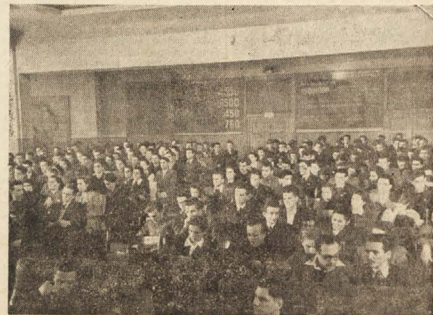
Delegati v dvorani