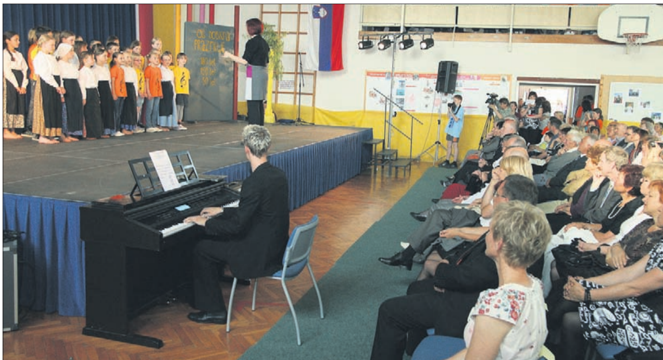
Pogled na polno dvorano in otroški pevski zbor, ki je uvedel glasbeni del programa slavnostne akademije ob jubileju šolstva na Dobrni. OŠ Dobrna je ob tej priložnosti dobila svojo himno.