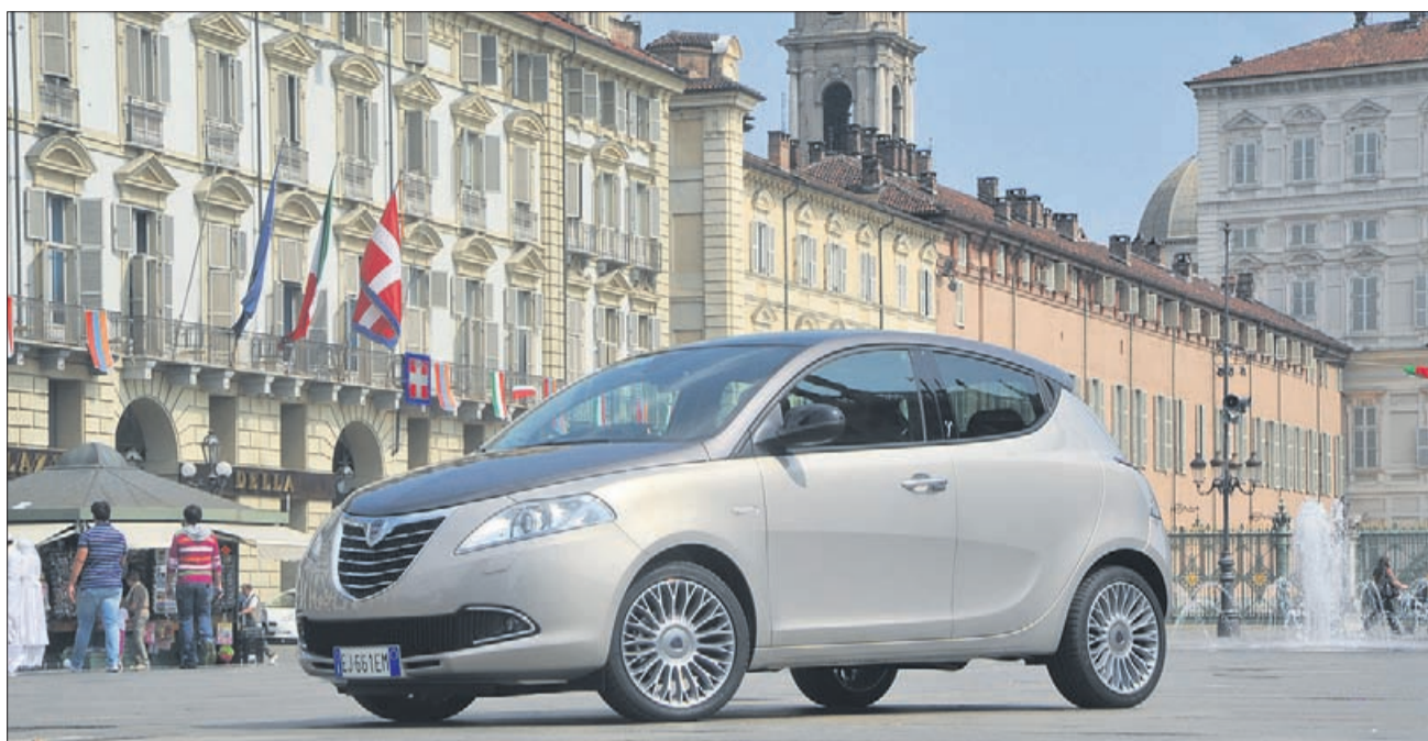
Lancia ypsilon naj ne bi bila všeč samo ženskam.