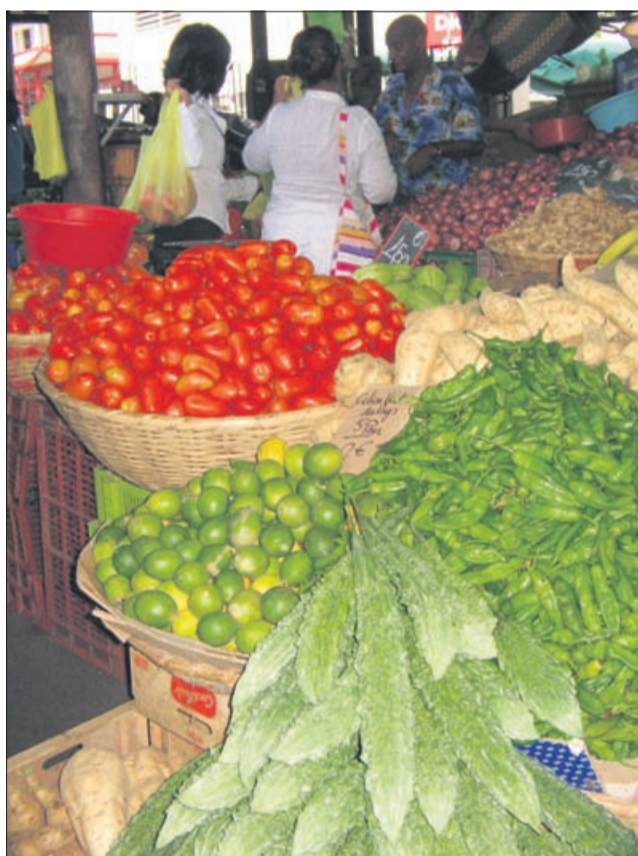
Pestra izbira na tržnici nikogar ne razočara.