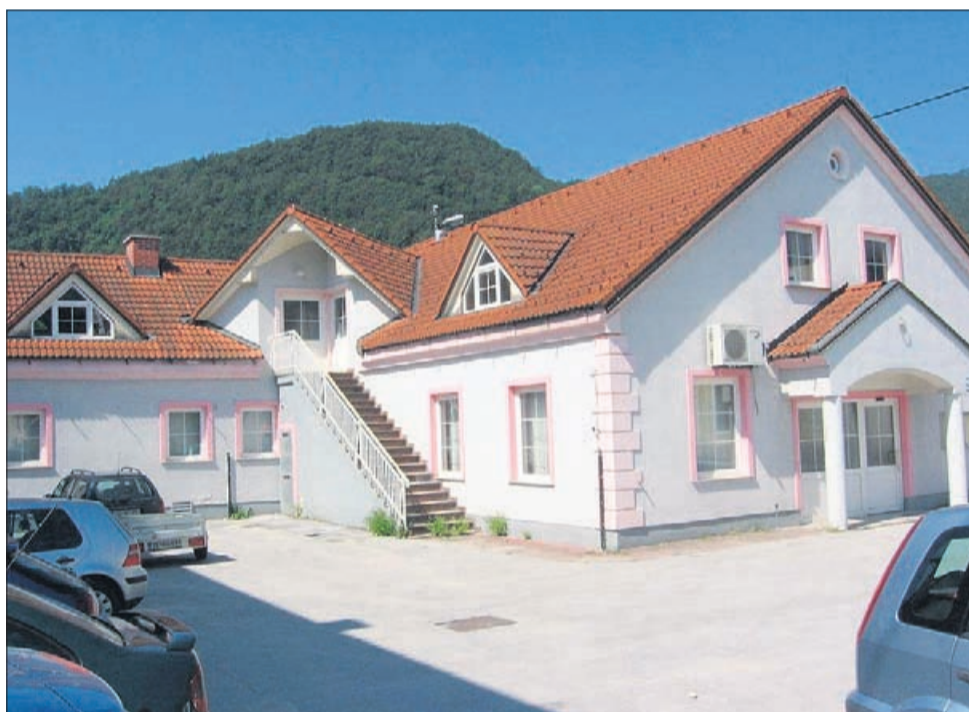
Za zdravstveno postajo v Vitanju je občina kupila novo, prijaznejše domovanje (na fotografiji).

sedanji generaciji, ki se trudi njihovo delo nadaljevati. IS