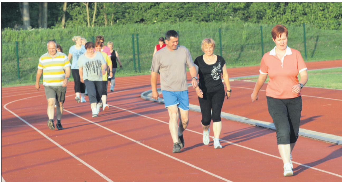
Test hoje na dva kilometra je tudi test kondicije.

Tudi če številka na tehtnici ostaja ista, je dobro, da se ne zviša. S kombiniranjem hrane s pomočjo prehranske piramide poskrbimo za vnos potrebnih kalorij in skrbimo, da nam želje ne narekujejo jedilnika. Da pa ne bi po svetu hodili brezvoljni in zamorjeni, tudi prim. Jana Govc Eržen iz izkušnje ve,