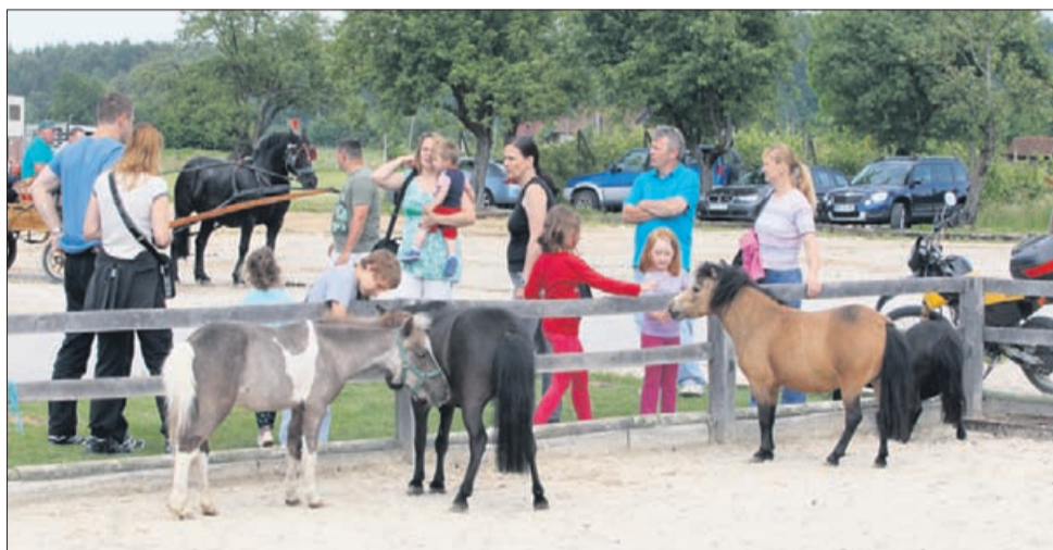
Kam so izginili vsi otroci? Ah, saj res, poniji so tudi tukaj. Ko bodo veliki, bodo gotovo želeli sestiti tudi na kakšnega večjega konja. Sploh pa ni prezgodaj, že se lahko vpišejo v šolo jahanja.

nad odzivom obiskovalcev navdušena. Je pa tudi res, da so v organizacijo vložili veliko truda. »Otroci so seveda najprej pohiteli k ponijem, ki so jih lahko tudi krtačili. Predvsem so jih trepljali in božali, veselje pa je bilo tolikšno, da so se še konjički malce izčrpali. Najbolj zanimivo je bilo ljudem opazovati podkovanje konj. Ves čas je bila tudi vrsta za jahanje konj, čakalne vrste so se nabirale tudi za vožnje s kočijami. Celó zame je bila nekaj novega predstavitev western jahanja, ki je ljudi mimogrede prestavila