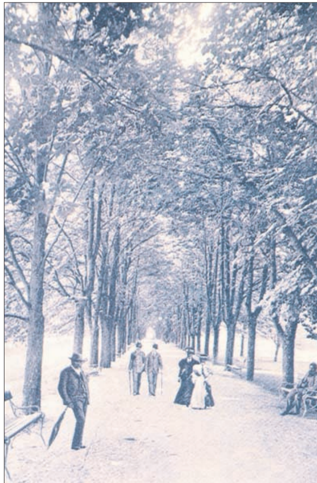
Sprehajalci v kostanjevem drevoredu v celjskem parku okoli leta 1900