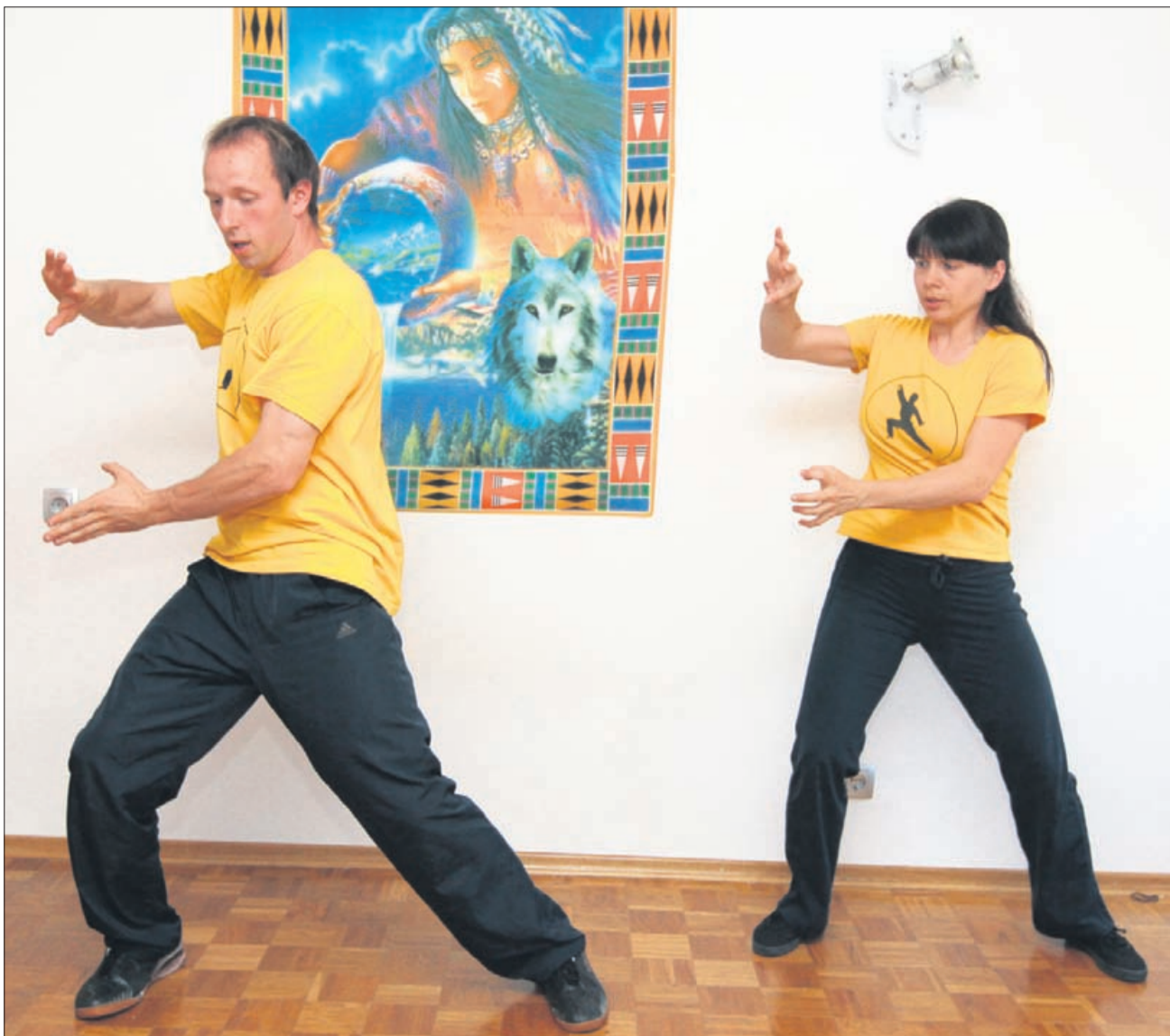
Tine in Ajša. Vir večine težav je v tem, da ljudje ne skrbimo za svoj energijski potencial. Ko se notranja baterija popolnoma izprazni, nam tudi najbolj globoka želja po ozdravljenju ne pomaga več. S tehnikami dosežemo veliko pozitivnega, za mnoge pa je na prvem mestu seveda telesno zdravje.