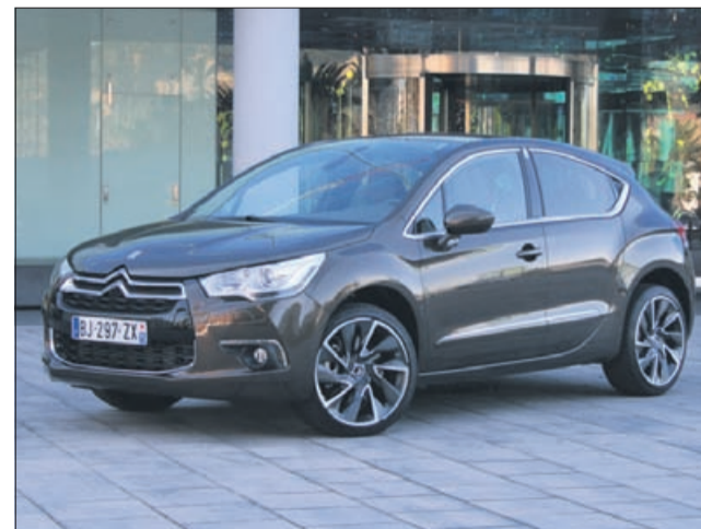
Citroën DS4 je že na našem trgu.