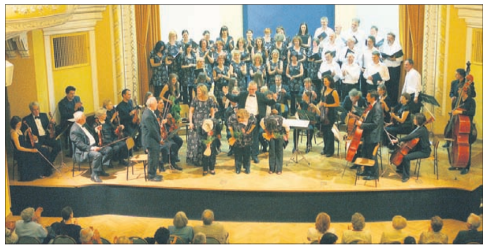
Celjski godalni orkester je sezono sklenil z Vivaldijevo Glorijo, pri izvedbi katere je združil moči z Akademskim pevskim zborom Celje.