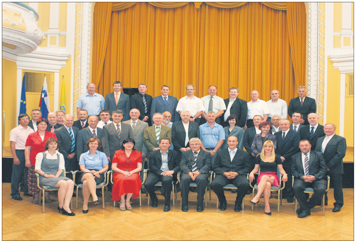
Podpisniki Deklaracije trajnostnega razvoja Savinjske regije

Med podpisniki deklaracije je tudi naša medijska hiša NT&RC, sledila pa naj bi še številna druga podjetja s Celjskega.