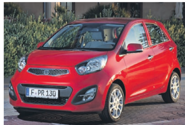
Za kio picanto je treba odšteti približno 7 tisoč evrov in več.