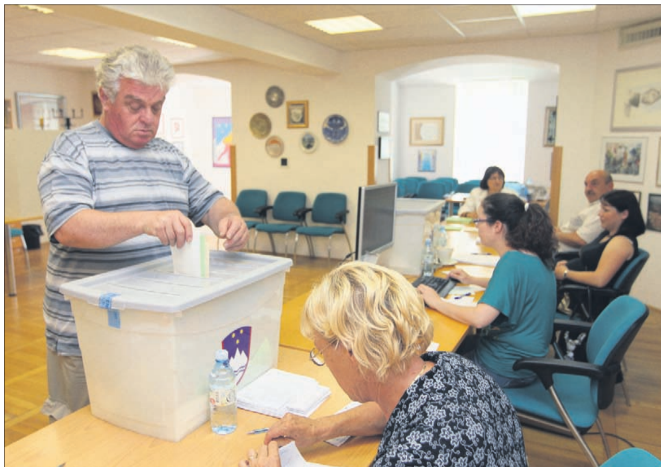
Od torika do vključno včeraj so bila na sedežih okrajnih volilnih komisij odprta volišča za predčasno glasovanje.

Da bi bili tako starejši kot mlajši delavci »zanimivi« delodajalcem in da ti ne bi stavili samo na najbolj produktivne v zrelih letih, zakon prinaša bonuse tudi njim. Starejši delavci bodo namreč za delodajalce »cenejši«, ker se jim bodo po izpolnitvi pogojev za predčasno upokojitev v prehodnem obdobju prispevki znižali za 50 odstotkov (nato pa za 30 odstotkov, op. p.). Po novem zakonu bi s 1. julijem delodajalci lahko uveljavili tudi subvencije za zaposlovanje mladih. Za delavca do 26. leta, zaposlenega za nedoločen čas, bi jim država primaknila v prvem letu polovico, v drugem letu pa 30 odstotkov prispevkov.