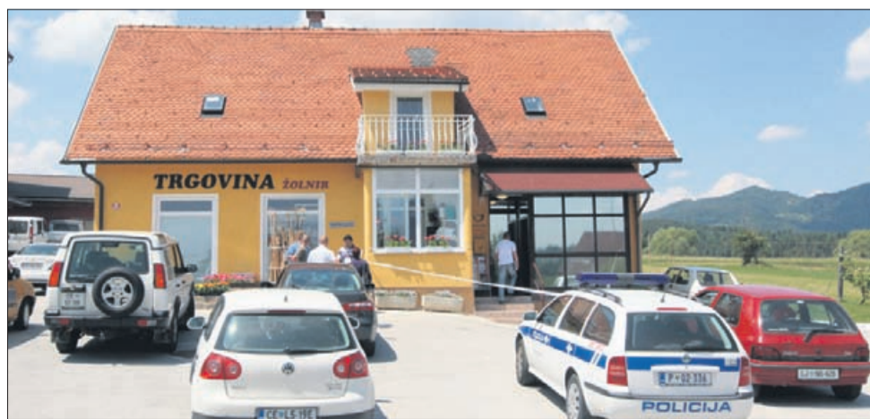
Pošta je v desnem delu stavbe. Tudi trgovina na levi naj bi bila pred časom že oropana.