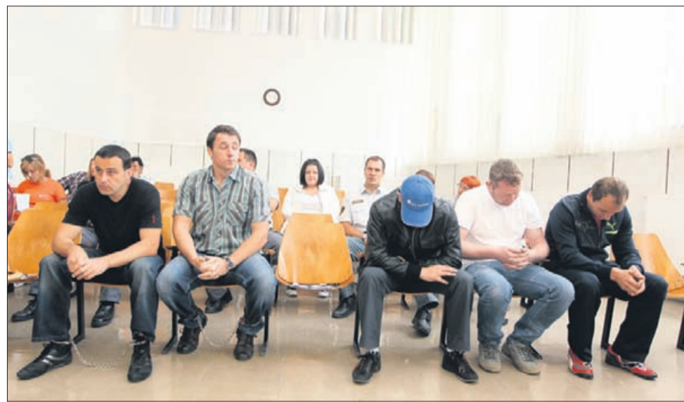
Obtoženi za rop Lidla in poskus tatvine v šentjurskem Akvoniju. Na sliki manjkajo trije obtoženci, med njimi tudi mladoletnik.