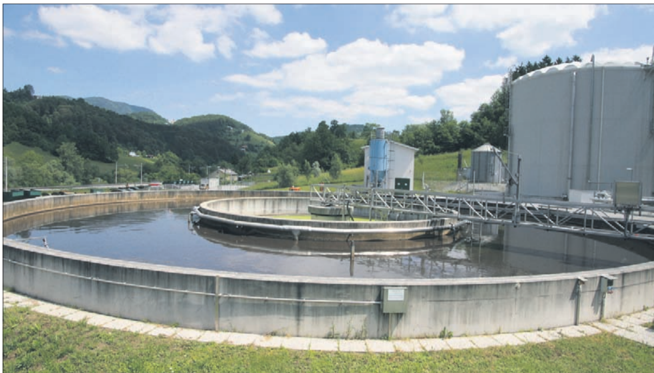
Še vsaj dva meseca bo s čistilno napravo v Laškem upravljala nemški WTE.