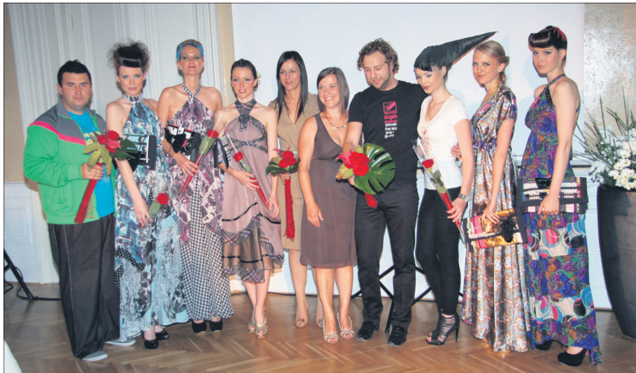
Manekenke in organizatorji revije