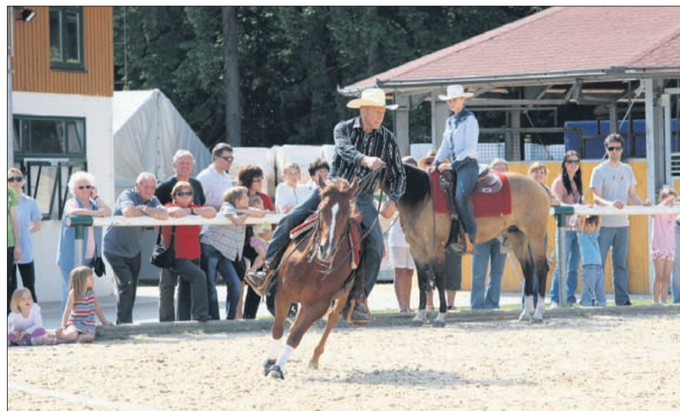
Divji zahod?! Ne, dan odprtih vrat centra konjeniških športov. Jiiihaaa!

na sceno snemanja kavbojskega filma. Lipicanci pa s svojo lepoto giba in pojave tako ali tako vedno očarajo,« je povedala.