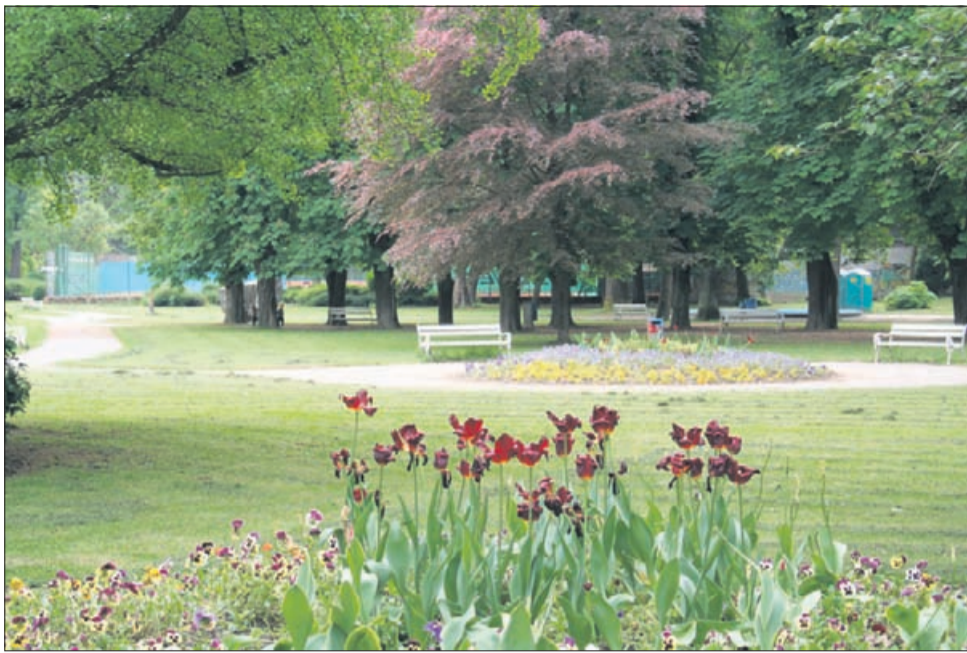
Park danes; cvetlični nasadi se še danes zgledujejo po predovjni vrtnarski tradiciji.