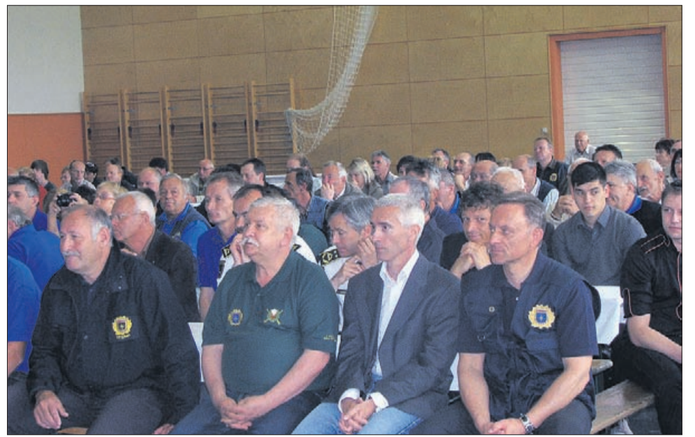
Drugi veteranski dan je v Mozirje privabil mnoge, ki so sodelovali v osamosvojitveni vojni.