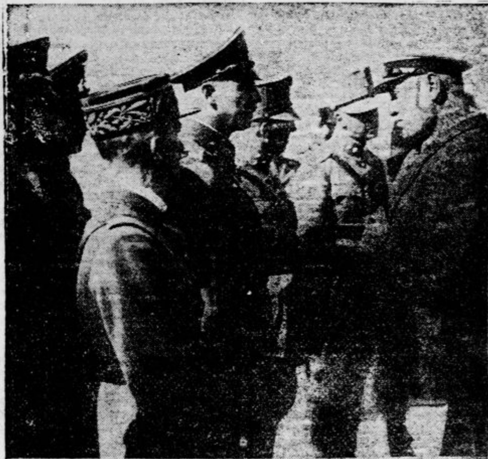
Duce se razgovarja z vojaškimi atašaji Francije, Nemčije in Švice