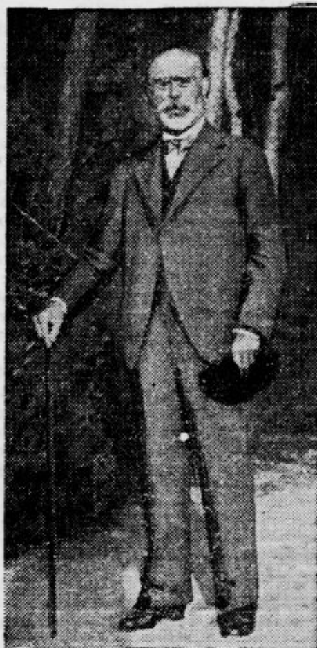
Francoski vnarnji minister Barthou na počitnicah v Švici

Čitajte tedensko revijo „ŽIVLJENJE IN SVET“