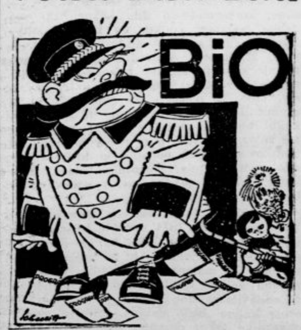
Dobila se stvar, Moša, on ima kratke hlačke