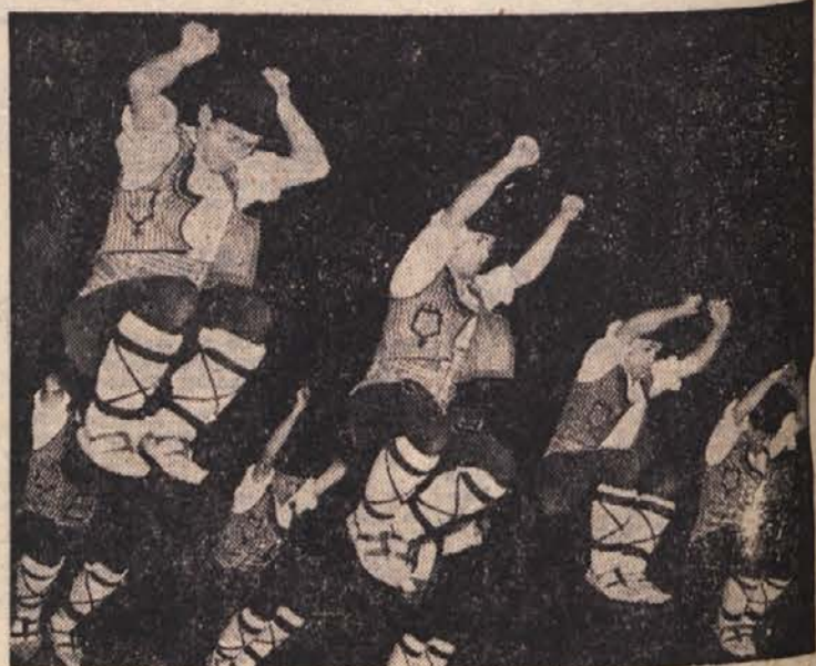
Visoko so skakali bolgarski pesalci, ki so se skupno s sto pevci in godci v ljudskih nošah udeležili nedavnega britanskega festiva. Posnetek kaže moško plesno skupino

Sezona gre h koncu, mnogim se mudi, zato je bil v nekem listu tudi tale oglas: »Iščemo tri ženske, ki bi zagotovile finančno brezskrbno bodočnost trem moškim. V zameno bodo postale grofice ali baronke.«