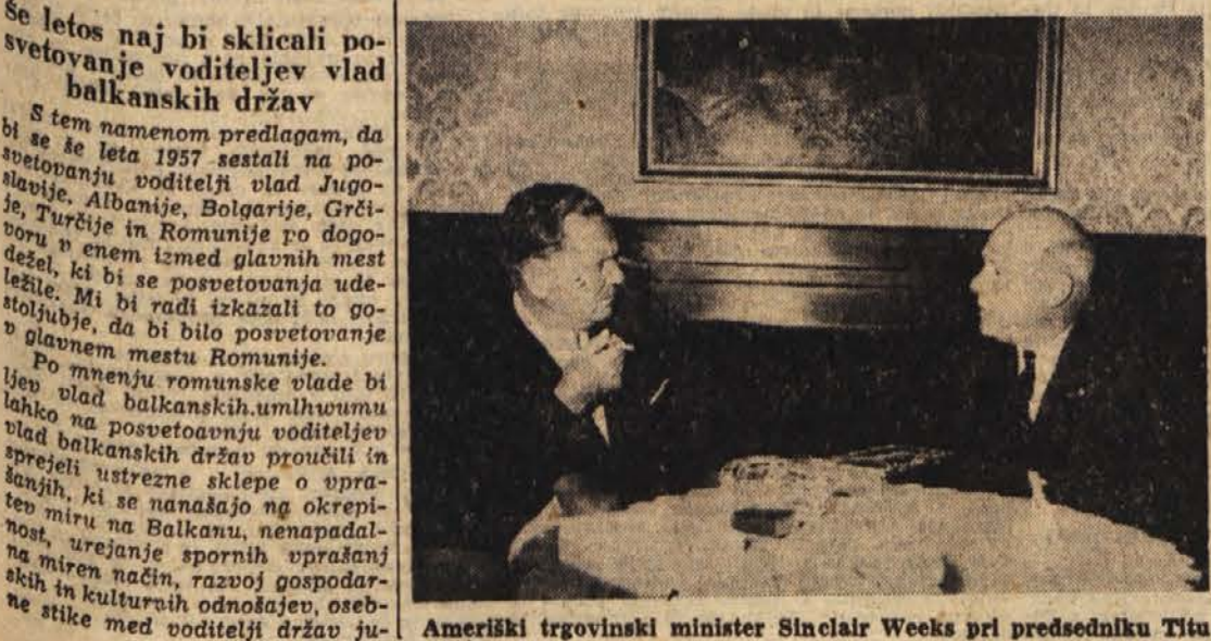
Ameriški trgovinski minister Sinclair Weeks pri predsedniku Titu