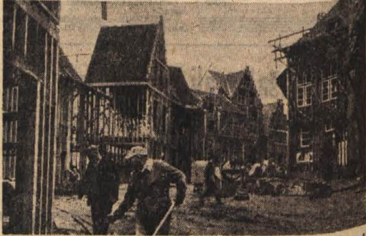
Za svetovno razstavo pripravljajo Belgijci tudi nekoliko pomamljano imitacijo starega Bruxellesa. Na razstavišču že gradijo mesino četrst s slikovitimi pročelji in s srednjeveškimi mestnimi vrati. Gostinsko osebje bo gostom postreglo v starih kostumih. Kdor si bo na razstavi zaželel idilike, se bo torej zatekel v »stari Bruxelles«

ko so 19-letnega filmskega igralca, ki je bil močno podoben italijanskemu diktatorju, na »višji ukaz« odslovili iz filmskih studiev rimske »Cinecittà«. V filmu »Saladin« naj bi fant igral glavno vlogo. Režiserju, ki je zastavil ves svoj vpliv, da bi prekalci prepoved, so povedali v notranjem ministrstvu, da »duce« ne more dovoliti, da bi njegov dvojniki na-