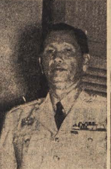
Maršal Sarit Tanarat