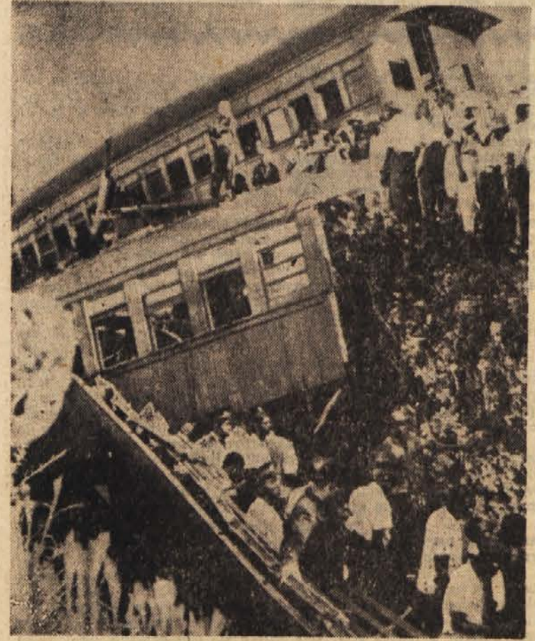
Nad 180 človeških življenj je zahtevala železniška nesreča na Jamaiki. Dvanajst potniških vagonov je skočilo s tira in zgrmelo po nasipu. Reševalna dela so bila dokaj težavna, ker je pretila nevarnost, da se bodo vagoni še enkrat prekucnili in zmečkali številne ranjence