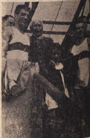
Nemški veslači so na evropskem prvenstvu dosegli velik uspeh. Veslači obeh Nemčij so namreč enotno nastopili. Slika prikazuje predsednika Zahodne Nemčije Theodorja Heussa z zmagovalnimi veslačema dvojico s krmarjem. Le-ta je bil dvanajstletni deček, ki je odlično opravil svojo nalogo