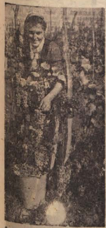
»Še nekaj dni, pa bomo začeli trgati od kraja. Zdad pa poigram le sladkega«