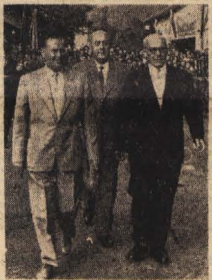
Dobri prijatelji in preudarni državniki

Posiljam Vama najiskrenejše želje za nadaljnji napredek Ljudske republike Poljske in za Važno osebno srečo.