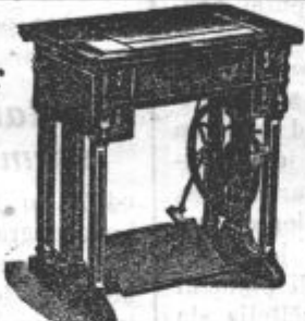
Zaloga v Kranju Trgovina Levičnik

blizu frančiškanskega mostu ob vodi. Telef. št. 29-18 Brezplačen pouk v vezenju. — Večletno jamstvo.