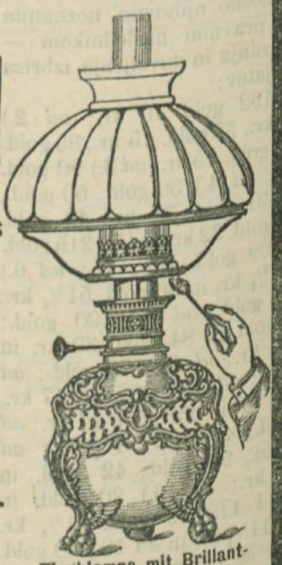
Tischlampe mit Brillant-Meteorbrenner.

R. Ditmar's Brillant-Meteorbrenner mit Kugelflamme Grössen: 15", 20", 25", 30", 35", 45" Leuchtkr.: 31 50 70 87 138 157 Kerzen für Tisch- und Hängelampen, Luster, Wandlampen, Laternen etc.