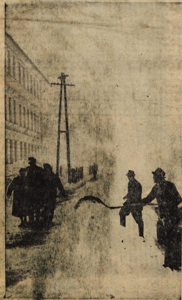
Tudi pešci so koristniki cest ali pločnikov po mestih. V zimskem času jih je prav gotovo več na cestah kot pa motornih vozil, zato bi morali biti tudi toliko skrbeti kot za najbolj prometne ceste z motornimi vozili. V Radovljici za pešce še kar skrbijo, vendar še mnogo premalo. Zadeva pa je glede tega v vseh ostalih večjih središčih Gorenjske še bolj kritična

GLASILO SOCIALISTIČNE ZVEZE DELOVNEGA LJUDSTVA ZA GORENJSKO