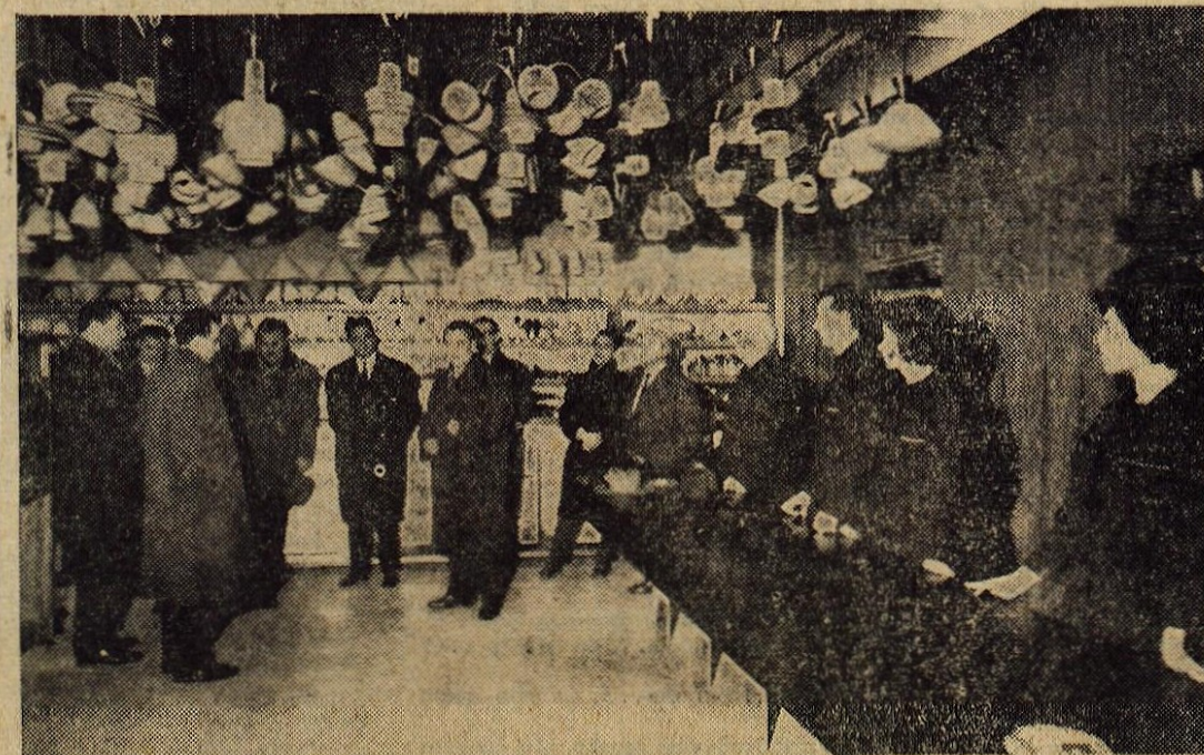
Zadnji petek v preteklem letu so Kranjčani dobili še eno preurejeno prodajalno. V središču mesta je odprla Elektrotehna iz Ljubljane svojo poslovalnico z veliko izbiro elektrotehničnih izdelkov za široko potrošnjo. — Na sliki: med otvoritvijo nove prodajalne

● KOVČKI S KNJIGAMI V OBEH DOLINAH — Ljudska knjižnica v Skofji Loki je naposled vsaj delno ustregla povpraševanju prebivalcev Selske in Poljanske doline po novih knjigah. V letošnji zimski sezoni bodo kovčki z največjimi knjigami prispeli v: Zeleznike, Selca, Dražgoše in Bukovšico v Selski ter v Javorje, Sovodnj in Gorenjo vas v Poljanski dolini. Nove kovčke pa težko pričakujejo tudi v Trebiji, Poljanah, Bukovici in Rečeah. Predvideno je, da bodo prišli kovčki v te kraje že v januarju oz. februarju, tako da bo željam bralcev leposlovnih knjig v glavnem zadosečeno.