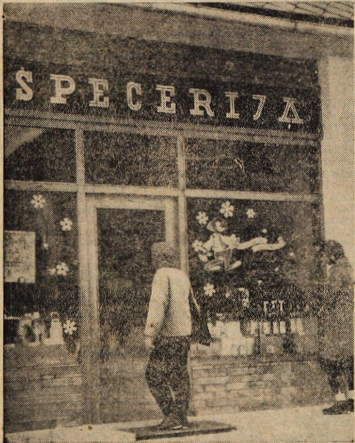
V Gorjah pri Bledu, so pred kratkim dobili skrbno urejeno novo prodajalno, poslovalnico trgovskega podjetja Specerija z Bleda