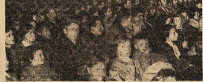
Občinstvo na festivalu

Ta festival je bil tudi priprava za jugoslovanski festival, ki bo 1. maja v Opatiji. Slednji pa bo priprava za svetovni kongres esperantistov, ki bo od 1. do 8. avgusta v Varšavi, kjer je dr. Zamenhof tudi pokopan.