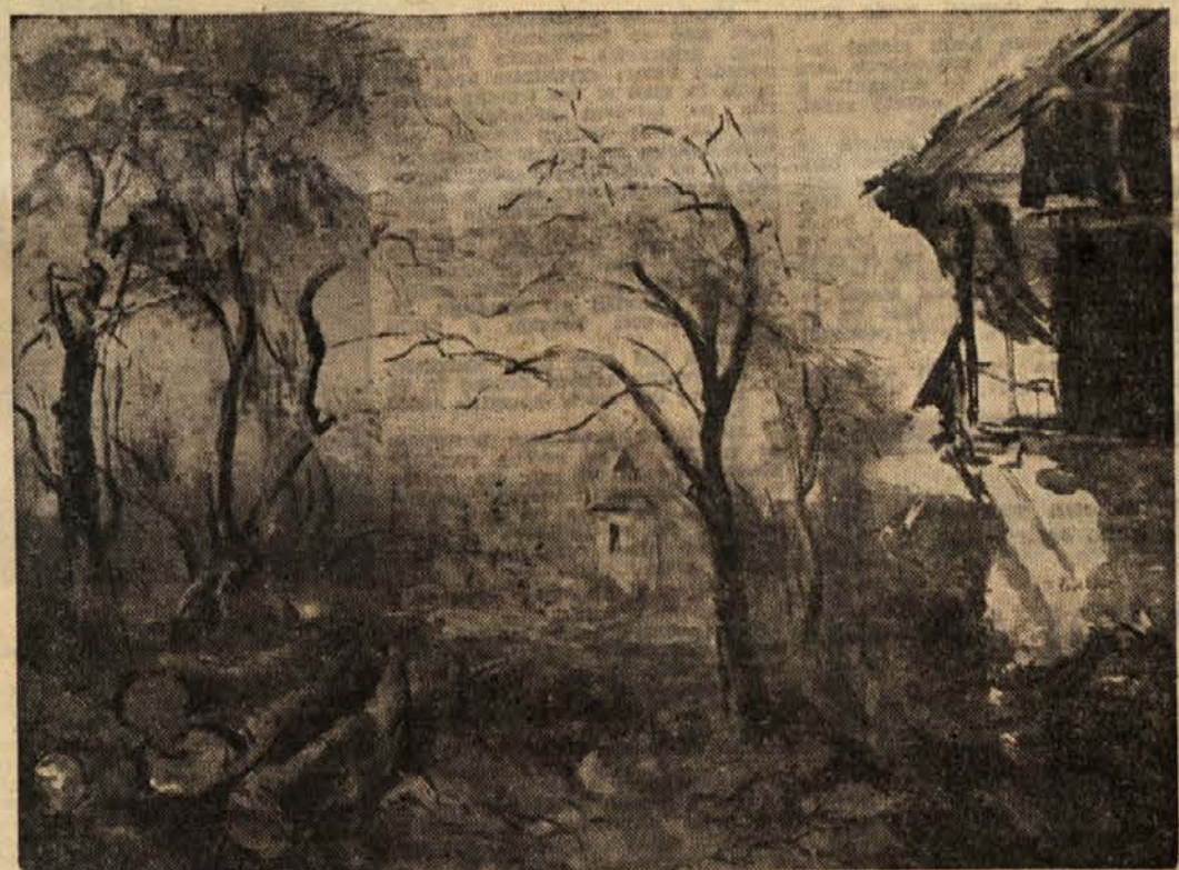
France Pavlovec: Prekmurska pokrajina