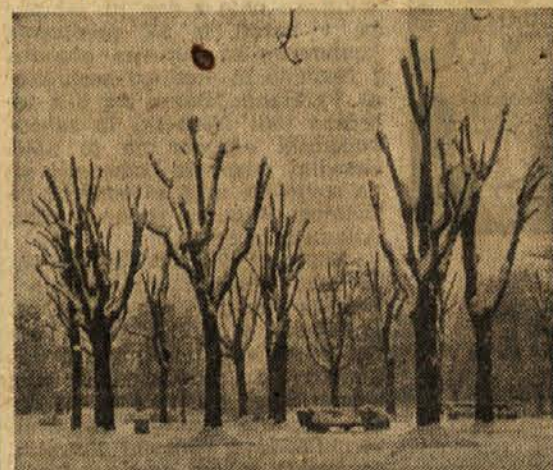
Mirni rogovileži v ljubljanskem Tivolju

veduje daljšega obdobja hujšega mraza, marveč nasprotno meni, da bo sneg kmalu skopnel. N. K.