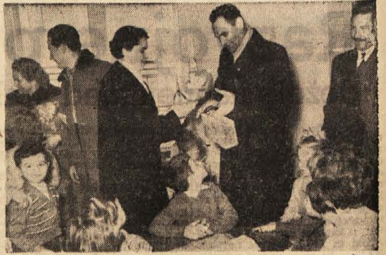
Ob otvoritvi otroške družinske ustanove v Zupančičevi ulici v Ljubljani