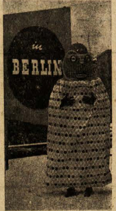
V karnevalskih dneh so v Berlinu nastopile tudi maskare v marsovskih oblekah. Tale na sliki se je zaradi večje prepričljivosti pripeljala s letalom

Neka britanska tovarna pohištva je pred kratkim razstavila v Londonu svoj najnovejši izdelek, ki mu je dala ime »postelja iz sanj«. S posebno napravo jo je mogoče v trenutku razstaviti in spet zložiti, ogreva jo električni tok, obložena je z žametom in s krznom kanadske kune, ima vgrajen čajnik, električni brivski aparat in pripravo za masažo. K sestavnim delom moderne postelje sodita še telefon in televizijski sprejemnik. Neki angleški časnikar, ki je opisal to novost, je dejal, da je na tej postelji mogoče tudi spati.