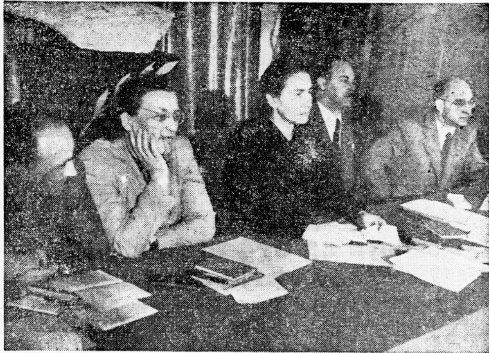
Tovarišica Vida Tomšič predseduje komisiji med razpravo o politično organizacijskih nalogah SZDL Slovenije

Nek tovariš je govoril o podjetju, ki neče razširiti svoje proizvodnje kremenčevega peska. To je po mojem ne samo gospodarska škoda, ampak tipično antisocialistično stališče. Dalje, če podjetja zaidejo iz raznih vzrokov v trenutno stagnacijo, poiščejo izhod iz tega v tem, da odpuste toliko in toliko delavcev. Tudi to je stvar, za katero bi se morale zanimati organizacije Socialistične zveze. Opozoril bi vas še na neko kontradiktornost, v kateri se nahajamo in je še nismo rešili. Na eni strani imamo neposredne proizvajalce s pravico upravljanja, in z vsem tistim, kar te pravice prinašajo. Na drugi strani pa se lahko ti isti proizvajalci jutri znajdejo na cesti. Kaj je potem z njihovo pravico upravljanja? Ne dajem tu neke rešitve tega vprašanja. Ne smete misliti, da sem zagovornik 'socialne', trdim, da je trenutna brezposelnost, čeprav je v njej sem in tja tudi nekaj težkih socialnih primerov, ki jih je treba videti in reševati, naši družbi koristna. Kljub temu pa je treba da organizacije Socialistične zveze pogledajo, kdaj se odpusča ljudi in da vprašajo, ali ste napravili vse za raz-