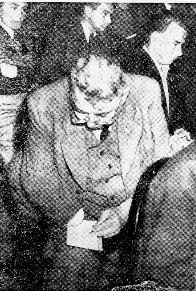
Delegat iz Zerjava pri črni Vinke Piskner beleži važne vprašanja, o katerih bo razpravljalo

Iz državnega sekretariata za gospodarstvo FLRJ 25. aprila 1953