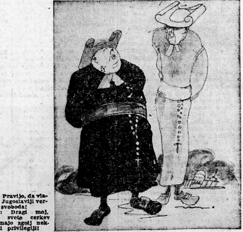
S: Pravilo, da vlada v Jugoslaviji verska svoboda! D: Dragi moj, niso sveto cerkev zanimajo zgolj nekdanji privilegiji!

Pred kratkim je senator Taft napisal in izdal knjigo »Zunanja politika za Američane«, ki je po vsebini le predvolilni pamflet. S to knjigo in z govori na mnogih javnih shodih, predvsem na jugu in zahodu ZDA, skuša Taft čim bolj diskreditirati demokratsko stranko in Trumanovo državno upravo ter si seveda pridobiti čim več pristavev. Na njegovo knjigo je takoj odgovoril demokratski senator McMahon s zelo ostrim in dobro utemeljenim kritikom. Opazovalci pravijo, da je Taftu že žal, da je knjigo sploh napisal. Od človeka, ki je pred leti verjel, da ni nič hudega, če Anglija pade — pravi McMahon, ne moremo pričakovati, da bi imel prav, ko pravi, da je sedaj zaveznitvo nujno, le z Anglijo, medtem ko ostala Evropa ni važna. Z naslov knjige vsiljuje misel, da dosevanje zunanja politika ZDA ni bila za Američane. In res tudi Taft neke v sredini knjige, da je bila dosedanja zunanja politika ZDA v prid samo — Sovjetski zvezi. Predsednika ZDA Truman.