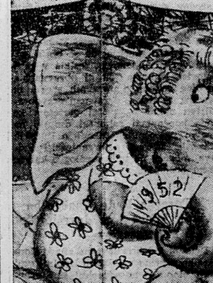
Ameriški listi so polni karikaturnih iz predvolilne kampanje. Posamezno karikaturo, ki jo je objavila »Evropa«, slika kaže »smadega« Tafta, ki na svo moč dvori lepi stonici (posebej na republikansko stranko); le-ta pa se še vedno kocke obira v stran, da bi morda našla še kakšnega mladčnika (Eisenhowerja)?

stranke Kalifornije; dobro ve, da za njega za sedaj še slabo kaže. Vendar pa se prav lahko zgodi, da bodo na strankinem kongresu glavni kandidati drug drugega blokirali. V tem primeru bi prišel on v poštev kot kompromisni kandidat. Najglasnejši med vsemi, ki hočejo postati predsedniški kandidati, je senator Taft. Le-ta je posebno znan po svojem geslu iz leta 1940, ko je glasno oznanjal, da rajši vidi Nemčijo zmagati, kot da bi ZDA stopile v vojno. Še nedavno je izjavil, da je še vedno mnenja, da nemška zmaga nad Veliko Britanijo ne bi v ničemer ogrozila ZDA.