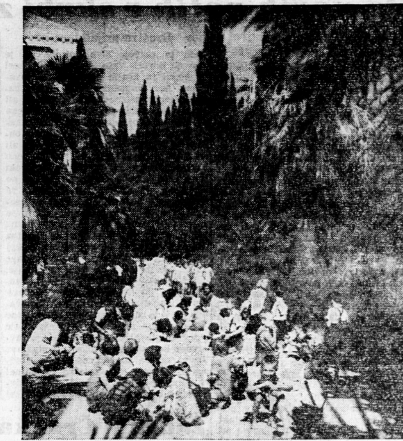
Medtem ko pri nas v Sloveniji vejejo mrzle sape in so gore na deželo zasnežene, je na Lapadu pri Lubu razstavljen svetli svet, toplo je in sije sonce kakor poteli. — Slika nam kaže otroke iz Dečjega doma na Lapadu.