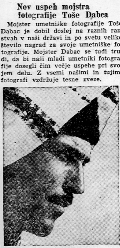
Toše Dabac: Makedonec Pred nekaj dnevi je bil mojster Dabac obveščen iz New Yorka, da je na veliki letni razstavi »Popular Photography« dobil štiri nagrade. Kako pomembna je ta razstava, najzgovorneje priča to, da je na njej sodelovalo nekaj tisoč razstavljalcev iz 35 držav, razstavljenih pa je bilo 55.698 fotografij.

Mojster umetniške fotografije Toše Dabac je dobil doslej na raznih razstavah v naši državi in po svetu veliko število nagrad za svoje umetniške fotografije. Mojster Dabac se tudi trudi, da bi naš mladi umetniški fotografiji dosegli čim večje uspehe pri svojem delu. Z vsemi našimi in tujimi fotografi vzdržuje tesne zveze.