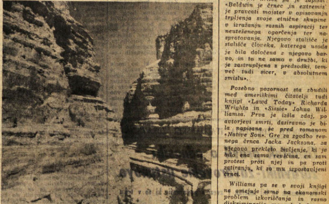
V oazo Ein Avdat se pride skozi gornjo romantično sotesko

BLIŽNJA (od 21. 3. do 20. 4.) S pomočjo dobrega sporazuma boste uresničili svoj načrt.