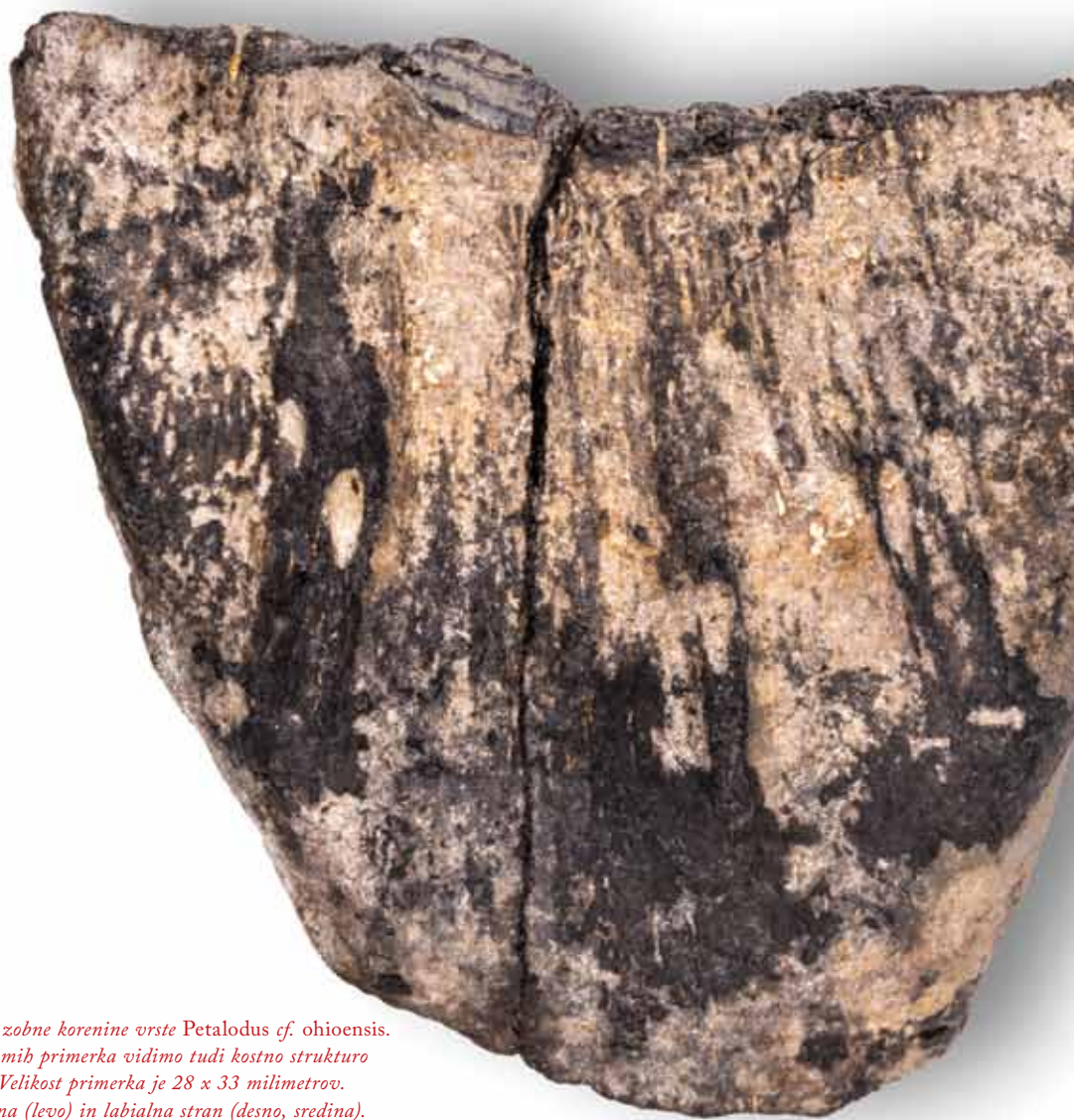
Ostaneek zobne korenine vrste Petalodus cf. ohioensis . Na prelomih primerka vidimo tudi kostno strukturo (desno). Velikost primerka je 28 x 33 milimetrov. Lingvalna (levo) in labialna stran (desno, sredina). Primerek hrani Prirodoslovni muzej Slovenije.

mih korenin lepo vidi tudi kostna struktura, ki jo nekateri raziskovalci imenujejo osteodentin oziroma ortodentin. Vrsta Petalodus ohioensis velja za značilno poznopaleozojsko vrsto hrustančnic, katerih ostanke zob so največ odkrili v Združenih državah Amerike, Rusiji, Italiji, Kitajski in tudi Sloveniji (Ginter s sod., 2010; Gai s sod., 2021).