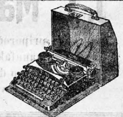
Telefon št. 2263

Parketne deščice Bakula Trstje za strope (leseno pletivo) za strope in stane Strešno lepenko in lesni cement Jos. R. Puch, Ljubljana Gradaška ulica 22 - Telefon int. 2513