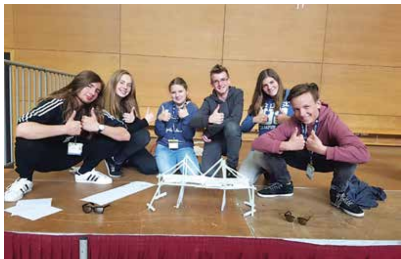
Slika 3: Skrivnostni izziv

Učenci se spopadejo z izzivom na ustvarjalnem in jezikovnem nivoju. Izziv je določen na dan tekmovanja, za pripravo pa imajo učenci na voljo največ 3 ure. Izziv, tako kot pri vseh ostalih kategorijah, sovpada s krovno temo tekmovanja. V skrivnostnem izzivu se učenci urijo v ustvarjalnem mišljenju in se učijo gledati na stvari iz drugačne perspektive, kar vodi k inovacijam. Kot primer naj navedem zadnji del te tekmovalne kategorije, kjer so učenci (v skupini jih je bilo 6) dobili določene rekvizite (slamice in papir) in so morali izdelati most. Most sta začela graditi 2 učenca, po nekaj minutah sta nadaljevala