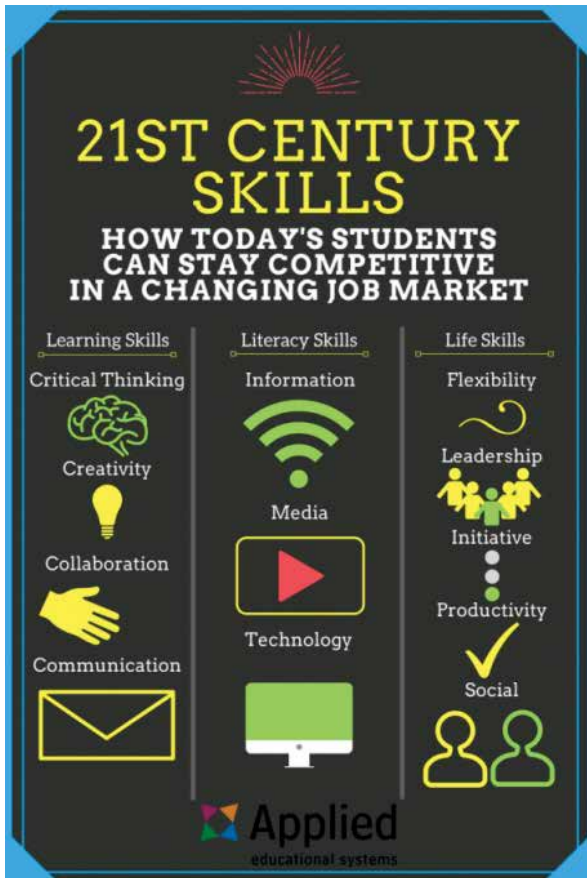
Slika 1: Kompetence 21. stoletja

Jezikovna olimpijada (BEO) je mednarodno tekmovanje iz znanja angleškega jezika za otroke v starostni skupini 12–16 let s poudarkom na komunikacijskih veščinah. Za sodelovanje sem se odločila zaradi same strukture tekmovanja, ki zahteva temeljito pripravo in sodelovanje z učitelji drugih predmetov. Takoj sem tudi prepoznala zahtevo po inovativnem pristopu dela z učenci, saj se pri pripravi na tekmovanje od učencev pričakuje visoko motiviranost, v zameno pa se jim ponuja način učenja, ki jim omogoča veliko ustvarjalnosti, sodelovalnega dela in pridobivanja jezikovnih kompe-