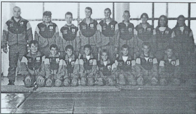
Naši tekmovalci - judoisti promovirajo občino Juršinci