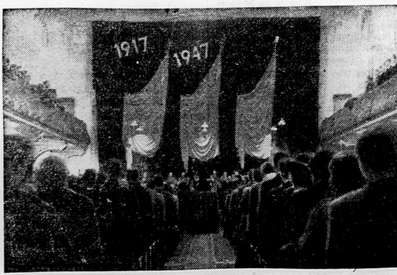
3. proslave 30 letnice Oktobrske revolucije, ki jo je predsedilo predsedstvo vlade LR Slovenije v unionski dvorani 6. novembra zvečer

V čem pa so te nove oblike v Jugoslaviji, ki so se pokazale na bazi idej Lenina in Stalina v novih pogojih, v pogojih malone tridesetletnega obstoja Sovjetske zveze in njene veličanske vloge v svetu? Prvič, nova oblika ljudske vstaje. Vstaja proti okupatorju in