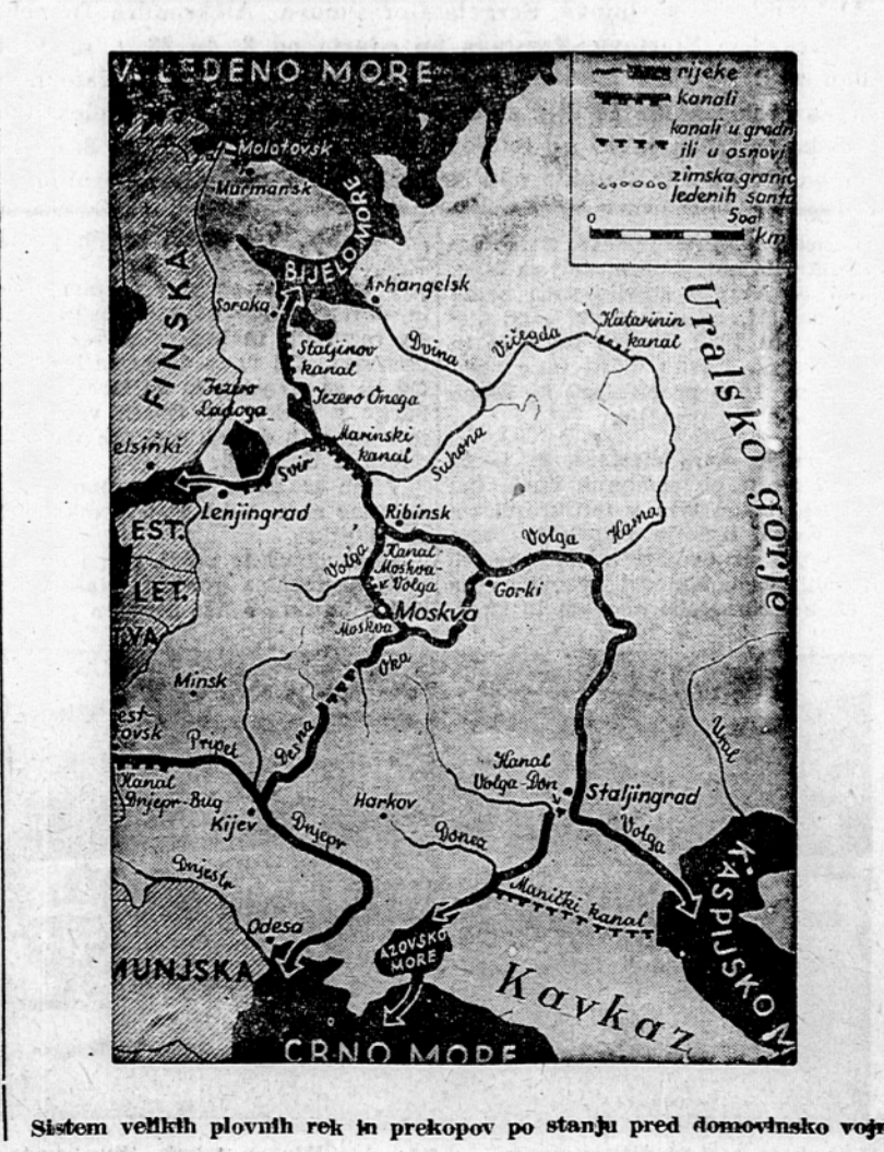
Sistem velikih plovnih rek in prekopov po stanju pred domovinsko vojno