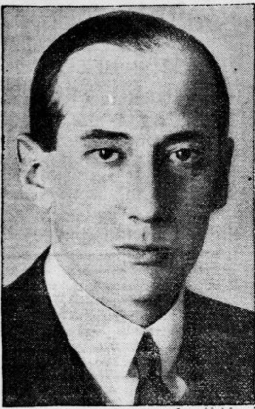
Jutri se pripelje v Beograd poljski minister za zunanje zadeve, polkovnik Beck. Njegovemu obisku pripisujejo političen pomen