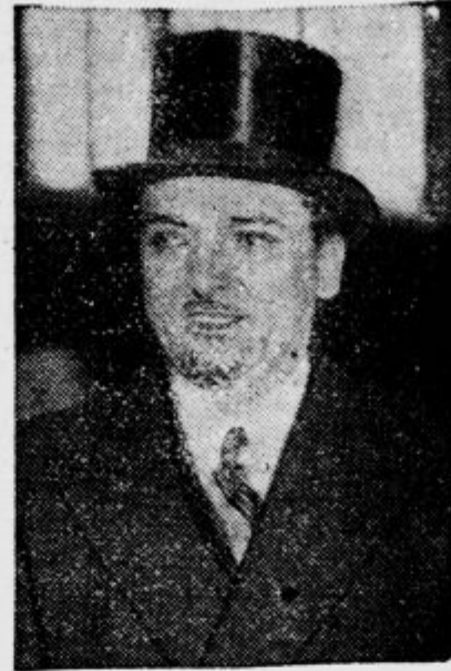
Italijanski poslanik v Londonu Dino Grandi, ki bo baje odpoklican