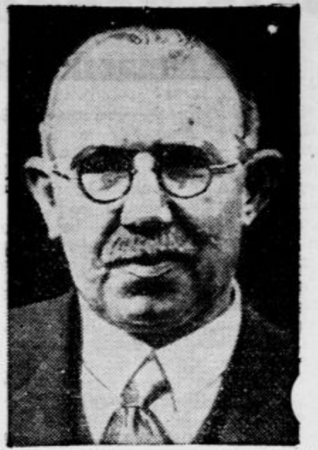
Anglijski minister za kolonije J. H. Thomas je odstopil in kralj je sprejel njegovo demisijo