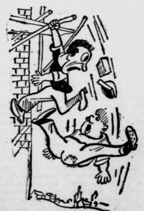
Delavec, ki je padel z ogrodka tovariš, ki se drži za prečko: »Ali nisi reševalcem, da lahko počakajo, ali naj pridejo pote pozneje?«