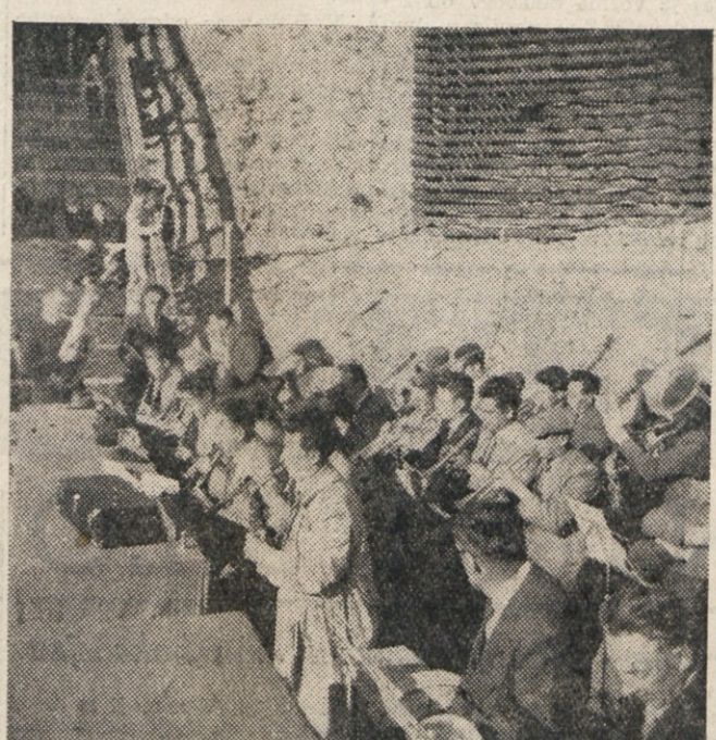
Godbi s Proseka in Plavlj.