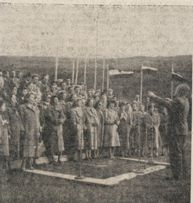
Združeni pevski zbori