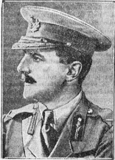
Sir Ronald Storr, guverner na otoku Cipru.