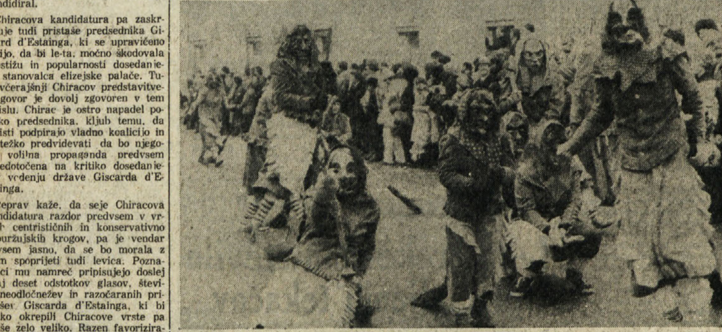
Vsako lahko izbere čarovnico, ki mu je najbolj všeč. To je geslo letošnjega prvega pustnega spreveda v Bregenzu, ki je bil v celoti namenjen svetu čarovnic