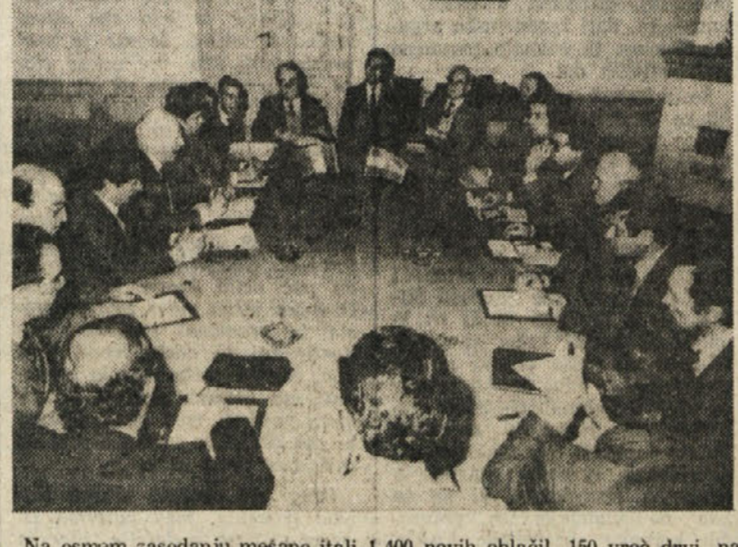
Na osmem zasedanju mešane italijsko-jugoslovenske tehnične komisije za odprtje mednarodnega mejnega prehoda Štandrež-Vrtojba, ki je potekalo včeraj dopoldne v beli dvorani goriskega zupanstva, so se načelno dogovorili, da bodo prehod uradno in svečano odprli v polovici letošnjega meseca maja. Člani obeh delegacij so se strinjali v tem, da bi bila na tej svečanosti navzoča dva ministra, ki bi zastopala rimsko in jugoslovensko zvezo vlado.

Takojšnja preusmeritev cestnega tovornega prometa od Rdeče hiše na novi prehod