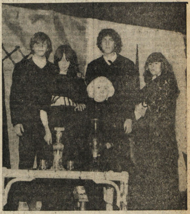
«Očetova dediščina» je naslov i- gri, ki jo je na oder v doberdobs- ki dvorani prosvetnega društva «Jezero» postavila v soboto večer pred kratkim ustanovljena, doma- ča animatorska skupina.

Doberdobsko občinstvo je spreje- lo to igro z izrednim zanimanjem in navdušenjem, kajti že leta ni bilo v domačem prosvetnem pro- storu take predstave z domačimi igralci. Posebna zahvala in pohva- la gre mladim igralcem samim, ki so si sami napravili odrske kuli- se in opremo brez vsakršne pomo- či od drugod. Kljub pomanjkljivo- sti, ki so govsem razumljive, so odigrali lepo in se vživeli v igro samo. Predstava ni bila dolga, to- da tudi to je razumljivo, ker so tekst sami napisali. Zahvala gre tudi vsem tistim, ki so zadnje dni pomagali pri ureditvi odra, luči in slik. Animatorska skupina bi žele- la seznaniti s to igro še več pu- blike in ne samo doberdobske. Za- to upa, da bo to odsko delo odig- rala še na marsikaterem našem odru. (Na naši sliki prizor iz «Oče- tove dediščine».) Marta Frandolič