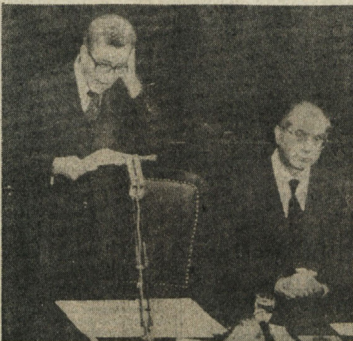
Ministrski predsednik Forlani med večerajšnjim govorom v poslanski zbornici

Pertinija, ki so sprožile vso polemiko, je Forlani govoril o »objektivnih podatkih«, o ugotovitvah, ki so s političnega vidika predvsem kriza poudarjanja napetosti kot rezultat napadalnosti in ekspanzionizma Sovjetske zveze. Kljub vsemu pa je Forlanijev poseg požel odobravanje v vrstah štiri vladnih strank. Javno so ga pohvalili vsi demokristijani, brez razlik med strujami. Republikanci svojega predsednika vlade poudarila, da pritiče njej in samo njej pri »ameriške stranke«. Tako, z milimetrskim merjenjem besed in izrazov, je Forlani dejal, da je res, da je treba terorizem uokviriti v širšo mednarodno stvarnost, a je takoj pristavil, da bi bile drzne ocene nesprejemljive. Toliko bolj na javnem mestu kot je parlament, vsekakor pa je bistvene važnosti, da se vlada z odločnostjo obveže tudi na področju črežanja vseh morebitnih tujih korenin, ki si jih je priskrbel terorizem. Glede izjav predsednika republike