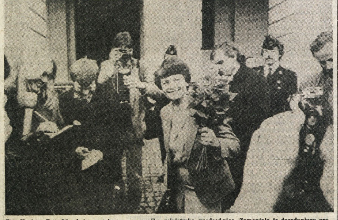
Gro Harlem Brundtland je postala nova norveška ministrica predsednica. Zamenjala je dosedanjega premiera Odvara Nordlija, ki je odstopil. Oba sta člana norveške laburistične stranke