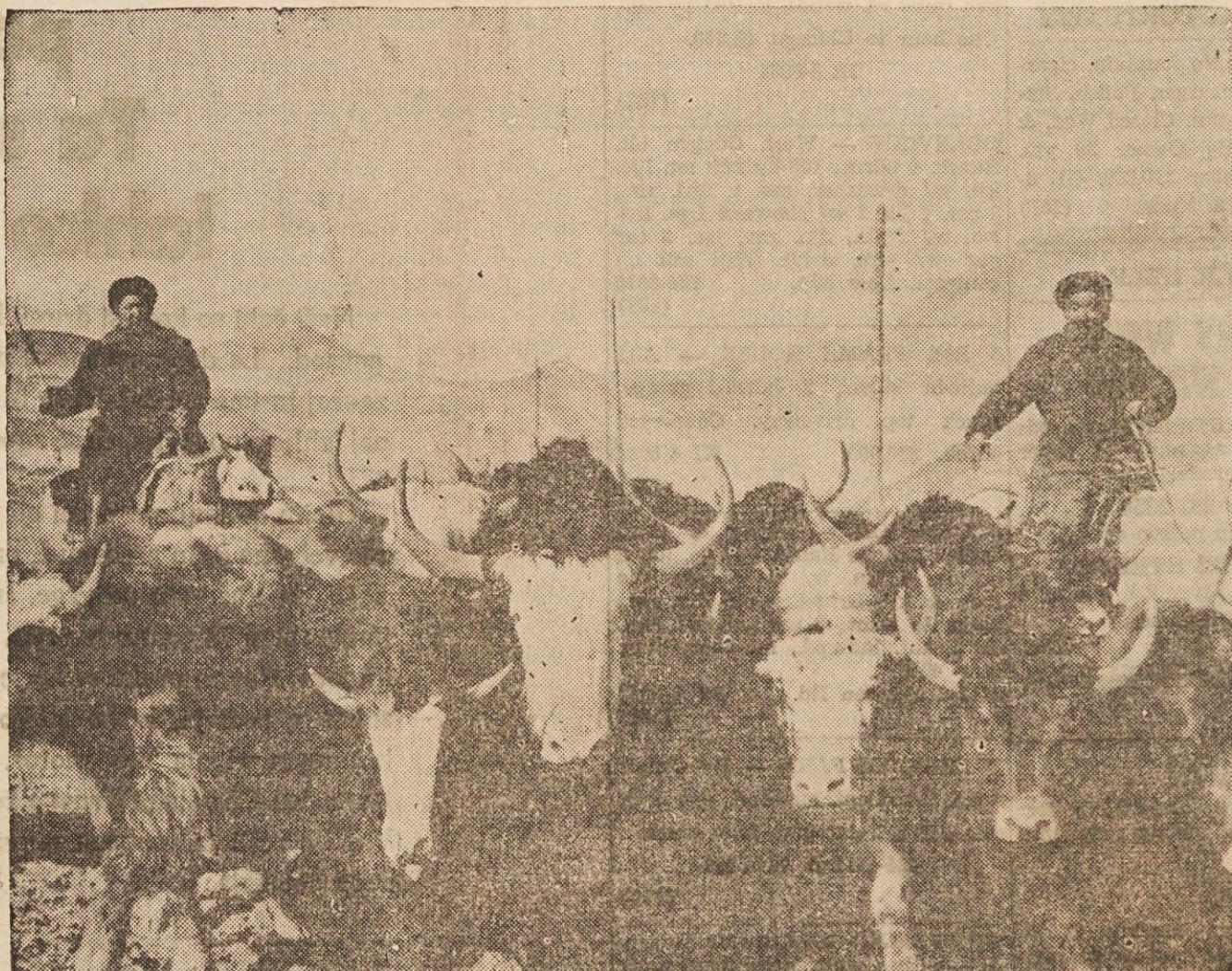
NA NOVE PASNIKE — Kirgiza v Južnem delu Sovjetske zveze ženeta svojo čredo jakov, posebne vrste goveda, na nove pašnike. Jak je zelo koristen, rede ga ne le za meso, ki je mehko in okusno kot telečje, ampak tudi zaradi krzna in mleka.

V najem Oddamo 3 sobe, zgoraj na Norwood Rd. Moški ima pred- nost. Kličite po 6. uri HE 1-8961. (153)