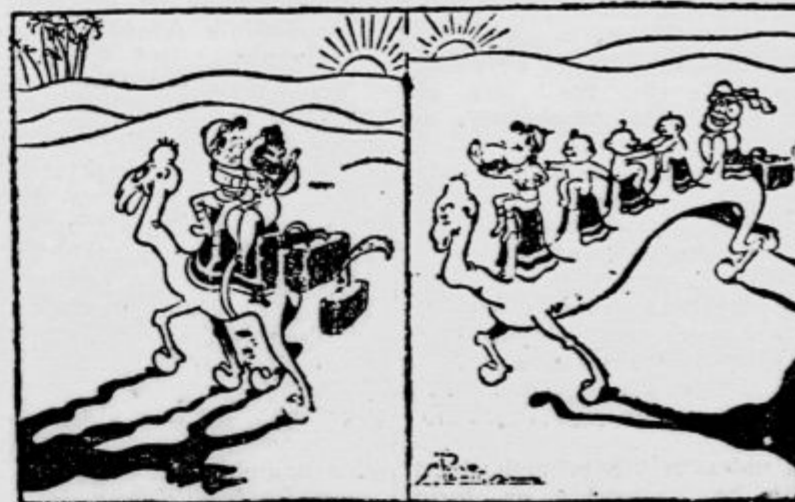
tja in nazaj