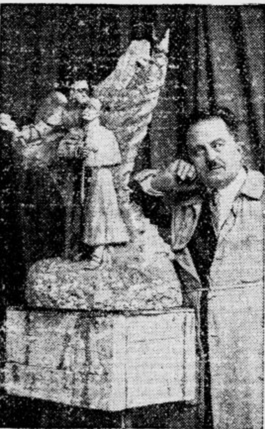
Kipar z osnutkom spomenika maršalu Fochu, ki ga bodo postavili v Parizu