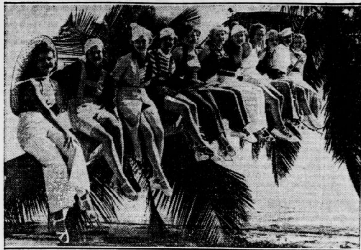
...lepa kalifornijska deklata pa kažejo že svoje nove kopalne kostume