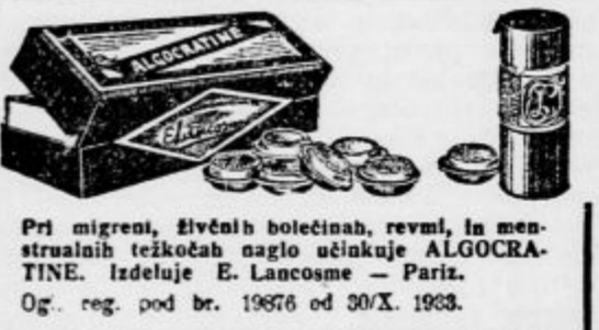
Pri migraciji, živčnih bolečinah, revmi, in menstrualnih težkočah začnejo učinkavati ALGOCRA-TINE. Izdajatelj E. Lacoste - Pariz.

• Izplačilo invalidskih podpor za pretekla proračunska leta. Gospod minister za socialno politiko in narodno zdravje je odredil izplačilo invalidskih podpor za pretekla proračunska leta.