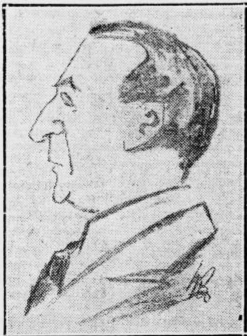
Sergej Aleksander Stavisky

Sleparska afera iz Poljske priseljenega pustolovca