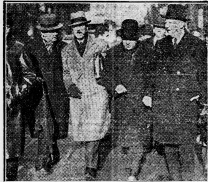
Člani preiskovalnega odbora zapuščajo pisarniške prostore pustolovca Staviskega v Parizu

Sicer pa niti listi niti javnost ne zvrčajo krivde v prvi vrsti na osebe (razen na glavnega nositelja tega škandala), temveč na sistem tako zvanega etatizma, na sistem udeležbe države in njenih posezkov v zasebno gospodarstvo. Polcija pa je začela s strožjim ocesom zasledovati delovanje raznih priseljenih pustolovcev. Da nima to nobenega vpliva na prijateljsko politiko, ki jo vodi Francija do raznih držav, n. pr. do Poljske, je umevno samo po sebi. O političnih posledicah afeje glej poročila med brzobjavnimi in telefonskimi vestmi.