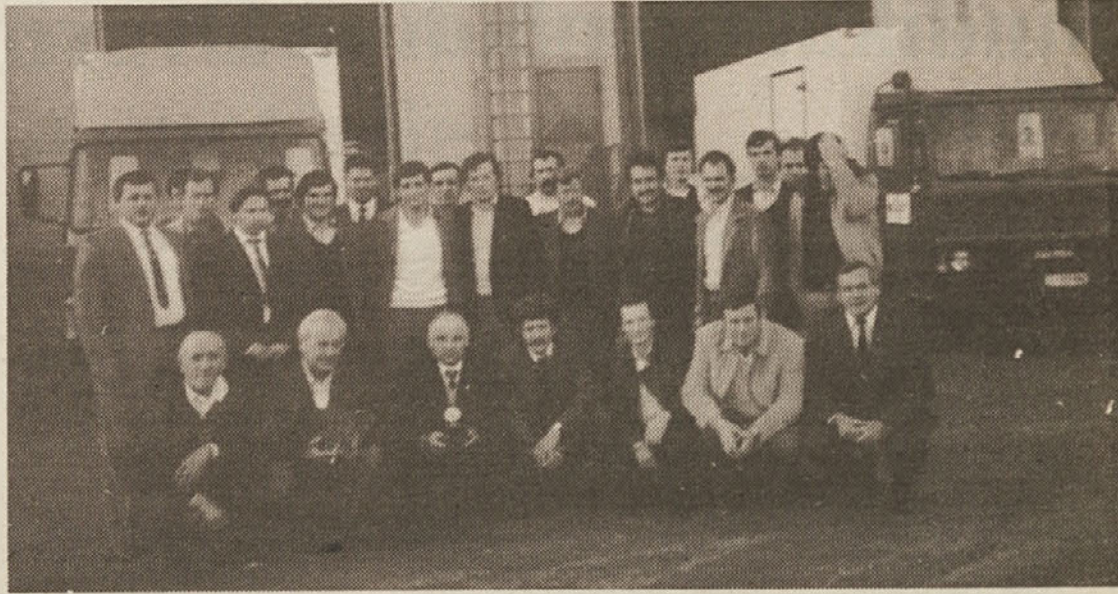
Predstavljamo vam tozid Transport in obrtne storitve