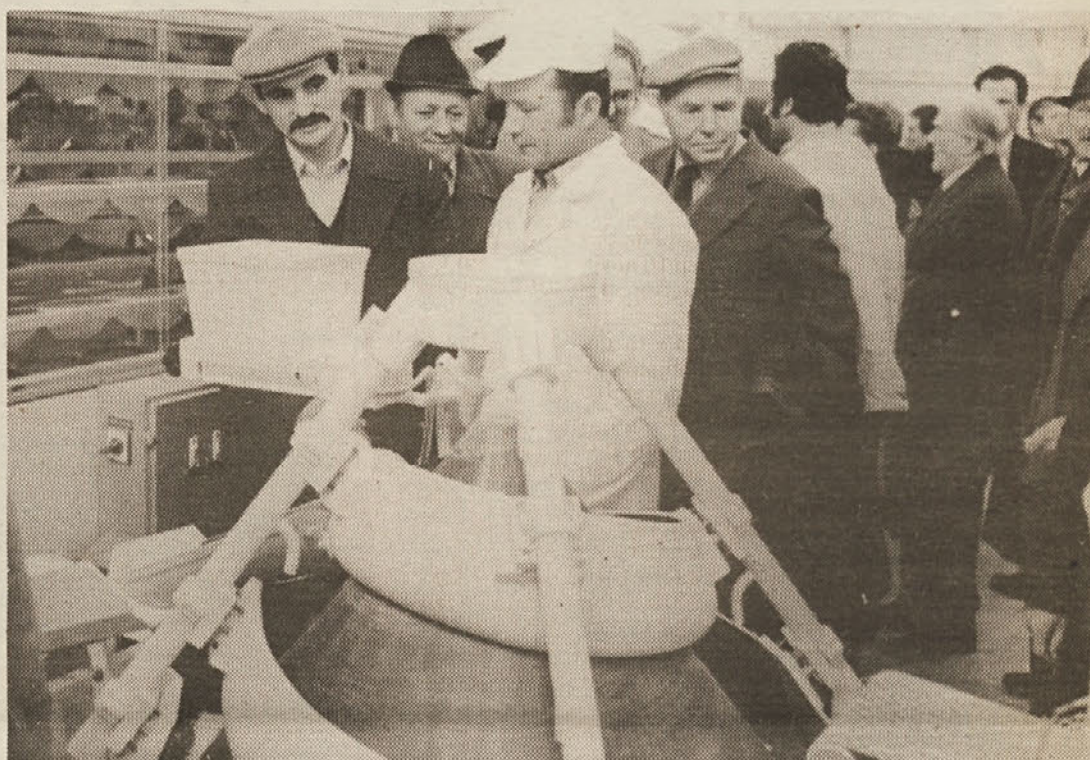
Po vključitvi mešalca za testo so si gostje, med katerimi pa je bilo zelo veliko upokoencev te delovne organizacije, ob pomoči tehnologov ogledali celotno strojno opremo za peko kruha.