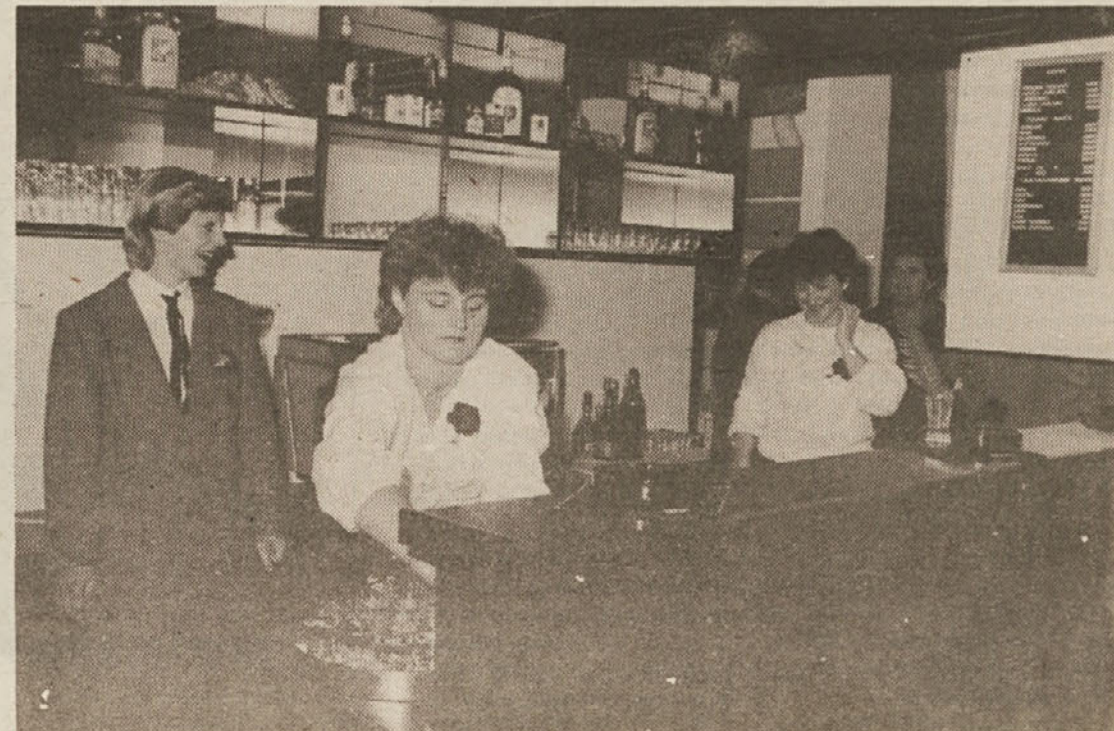
V novem naselju so odprli bife Robindvor