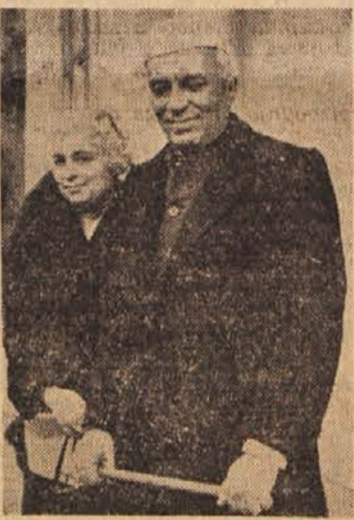
Džavaharlal Nehru in Vidja Pandit na konferenci dežel Britanske skupnosti

hodnji praktični ukrep. Konkretnih razgovorov z LR Kitajski ne bodo začeli, dokler ne bodo dobili nekaterih jamstev za uspeh.