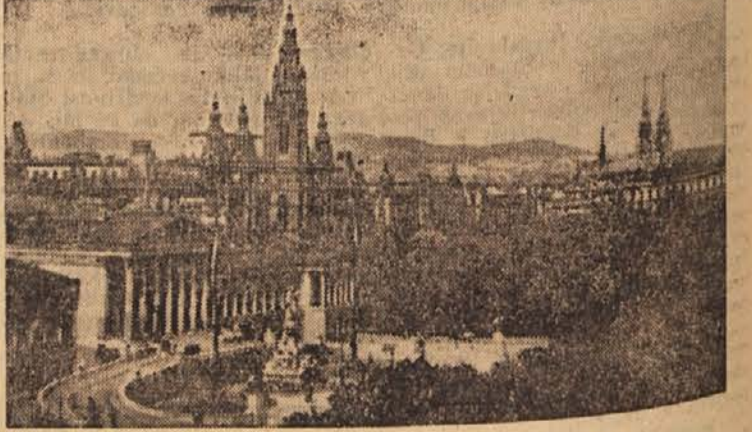
Palaca zveznega zbora na Dunaju