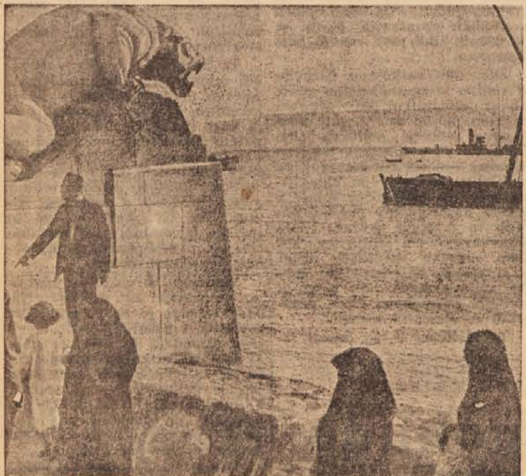
Ob vходу v Sueški prekop

Pomen Sueškega prekopa za gospodarstvo je naraščal ves čas po njegovi dograditvi. To najbolj vidimo iz podatkov o številu ladij