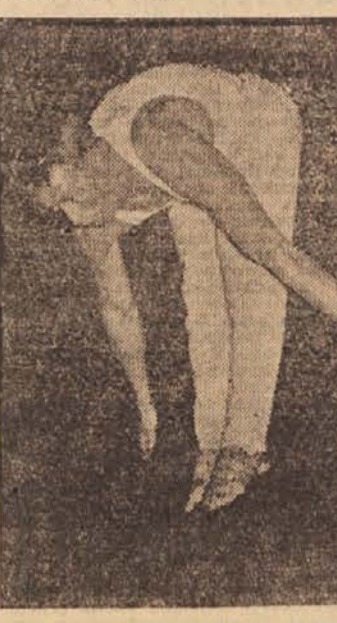
Lepo izveden zaključek vaje na kroglih

Skoraj vzporedno s tem tečajem sta bila organizirana dva tečaja, začetniški in nadaljevalni za ritmiko, ter nadaljevalni pri ženskih oddelkih. Nadaljevalni tečaj je bil organiziran na v Ljubljani in je že tedaj pokazal, da je ta panoga telesne vadbe postala zelo priljubljena pri ženskih oddelkih.