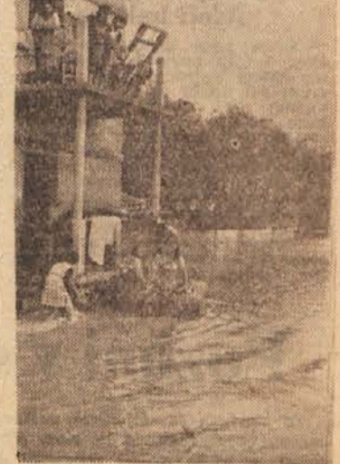
Ob lanski junijski poplavi v Celju. V tej hiši je bilo vode več kot meter visoko

Lanskoletna poplava je povzročila v mestu in okolici skoro štiri milijarde škode. Stroški za ureditev vodnega vozlišča bodo pa znašali le slabo tretjino te enkratne škode. Vendar pa Savinja dela škodo iz leta v leto. Poplav, ki jih nismo smatrali za katastrofalne, je bilo po statistiki do lani 188. Ob teh je pod vodo osem do deset km 2 zemljišča na severozahodni strani mesta. Tod je sedaj že 4 km 2 zamočvirnjene zemlje, ki je za kmetijstvo izgubljena. To pomeni pri narodnem dohodku 20 milijonov dinarjev letne izgube. Te poplave nastajajo zaradi plitkega dna Savinje. Od tod izvira tudi celjska megla, ki pred četrta stoletja še ni bila tolikšna, kot je zdaj.