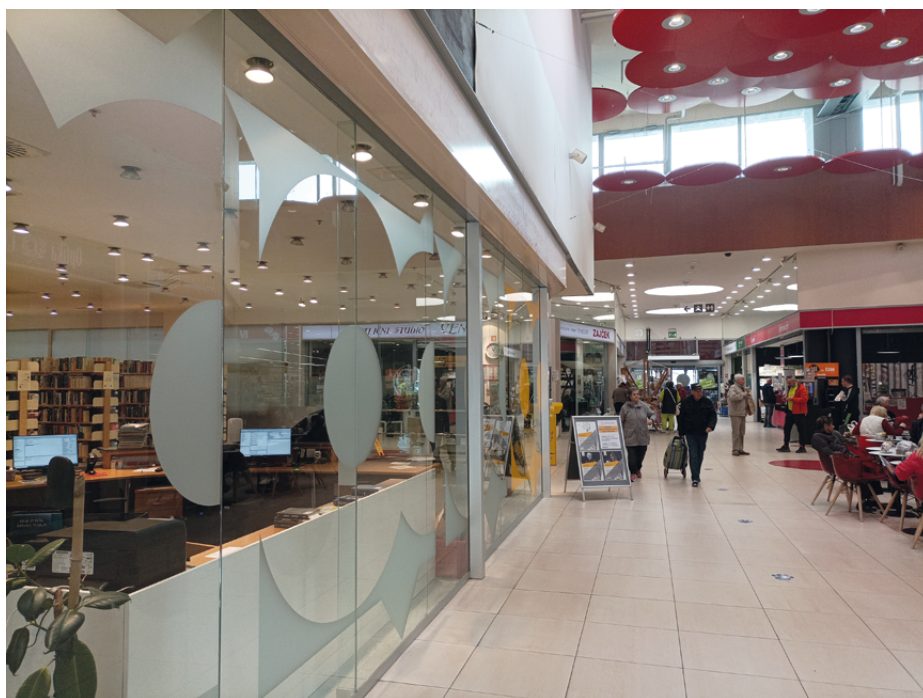
Slika 1: Umeščenost Knjižnice Pobrežje v trgovski center