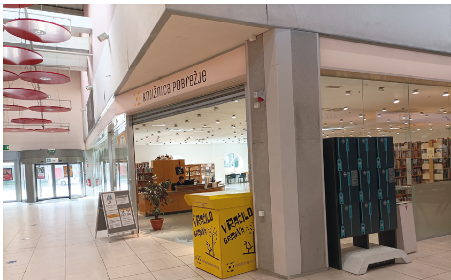
Slika 2: Umeščenost Knjižnice Pobrežje v trgovski center