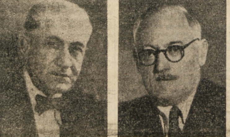
STANOJE SIMIĆ, zunanji minister FLRJ

Z zajemčenjem plovbe po Donavi je od prvih dni po končani vojni je Jugoslavija z dejniji pokazala, da hoče prispevati k utrditvi mednarodne solidarnosti in mirnega