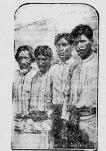
Indijanci plemena Yaquis. Pred dnevi so poročali ameriški listi, da je tolpa Indijancev Yaquis napadla pehotni bataljon Mehikancev in ga skoro popolnoma uničila.