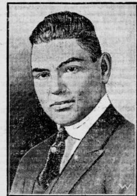
Jack Dempsey, dosedanji boksarski prvak sveta v težki kategoriji, ki ga je v četrtek v Filadelfiji premagal po točkah Genne Tunney. (Glej sportno rubriko.)