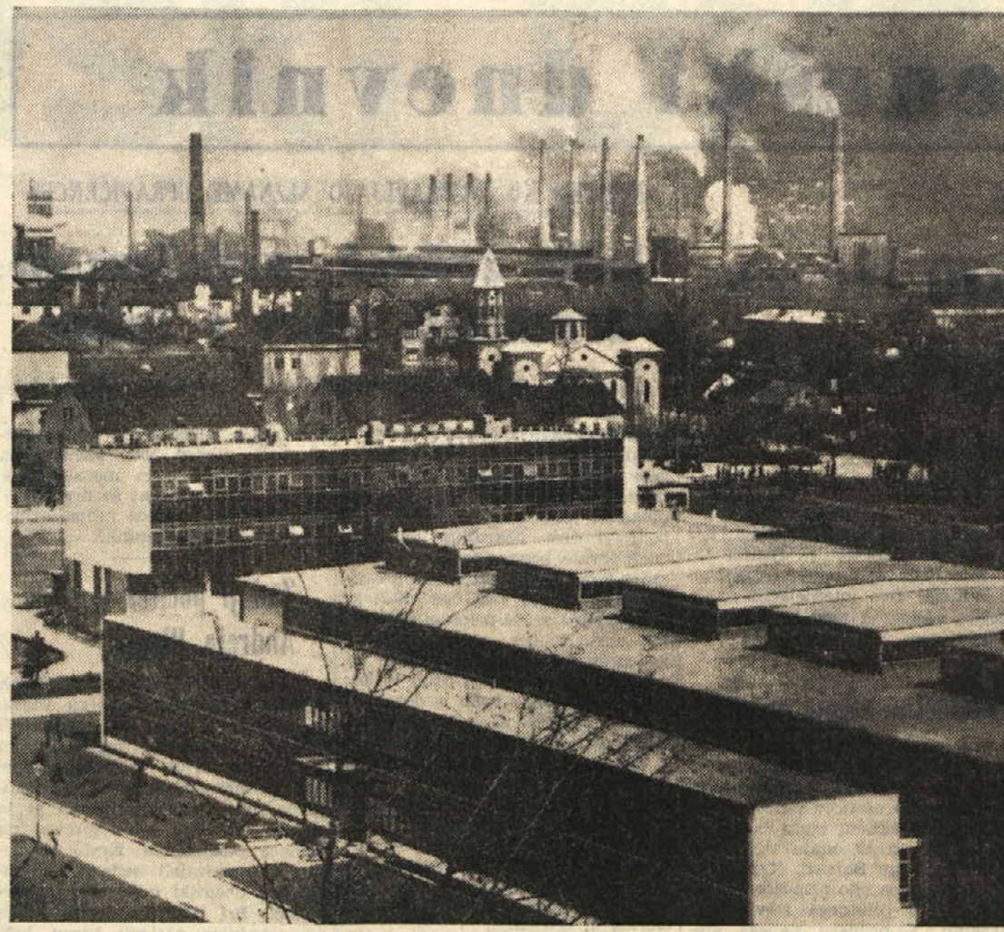
Zenica je bila pred zadnjo vojno komaj pomembno naselje, danes pa je važen industrijski center. V ospredju metalurški zavod, v ozadju dimniki plavčev