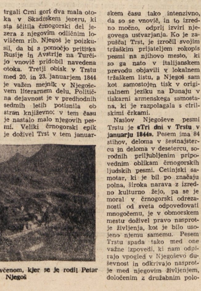
Pogled na vas Njegoš pod Lovćenom, kjer se je rodil Petar Petrović Njegoš