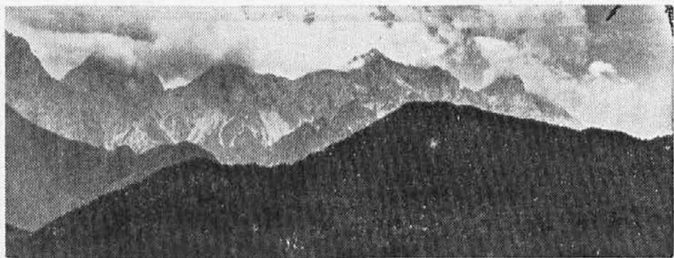
Pravljica gora Peca, pod katero se je v vasi Dolinčičah dne 9. marca 1885 rodil škof dr. Gregorij Rožman.

Bil nam je oče, bil je mojster naših duš, naš svečenik, prijatelj ubogih. In to ne samo nam! Vsej slovenski mladini. Še v večji meri kakor prej, nam je vse to danes kot škof. Ne more sicer med nas, kot je prihajal svoje dni. A vemo, da se v molitvi z Bogom razgovarja o nas, vemo, da se s svojimi žrtvami in v svojem trpljenju bori z Bogom za nas, vemo, da je kakor nekdanj, tako tudi danes ves naš! In mi smo njegovi! Njegovi načrti so naše naloge! Njegove želje so nam ukazi! Mi smo njegovi, njegovi v svojih molitvah, v svojem delu in žrtvah! Mi smo njegovi: vsi ena sama armada pod vodstvom svojega škofa! Zato je njegov praznik — njegova šestdesetletnica — tudi naš praznik.