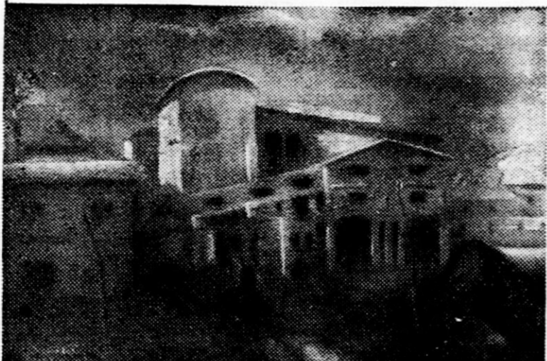
Stane Taufer: Bunkerji (pastel). Foto: Ami

Razumljivo, da so njegovi pasteli najzelošnjejša lirika, saj je mlademu človeku najbližja Baš to dokazuje, da je do samega sebe odkril in ne hlasta preko razvojne stopnje za različni izrazi, ki jih še ni mogel povsem doživeti. Zanimljen se sklanja nad črnim revirjem in odkriva lepote njegovega okolja. Čudi se in vedno bolj mršči čelo nad silni kontrasti: tu lepota, prelest barv in oblik, tam v sredi zasavane zagorske dol-