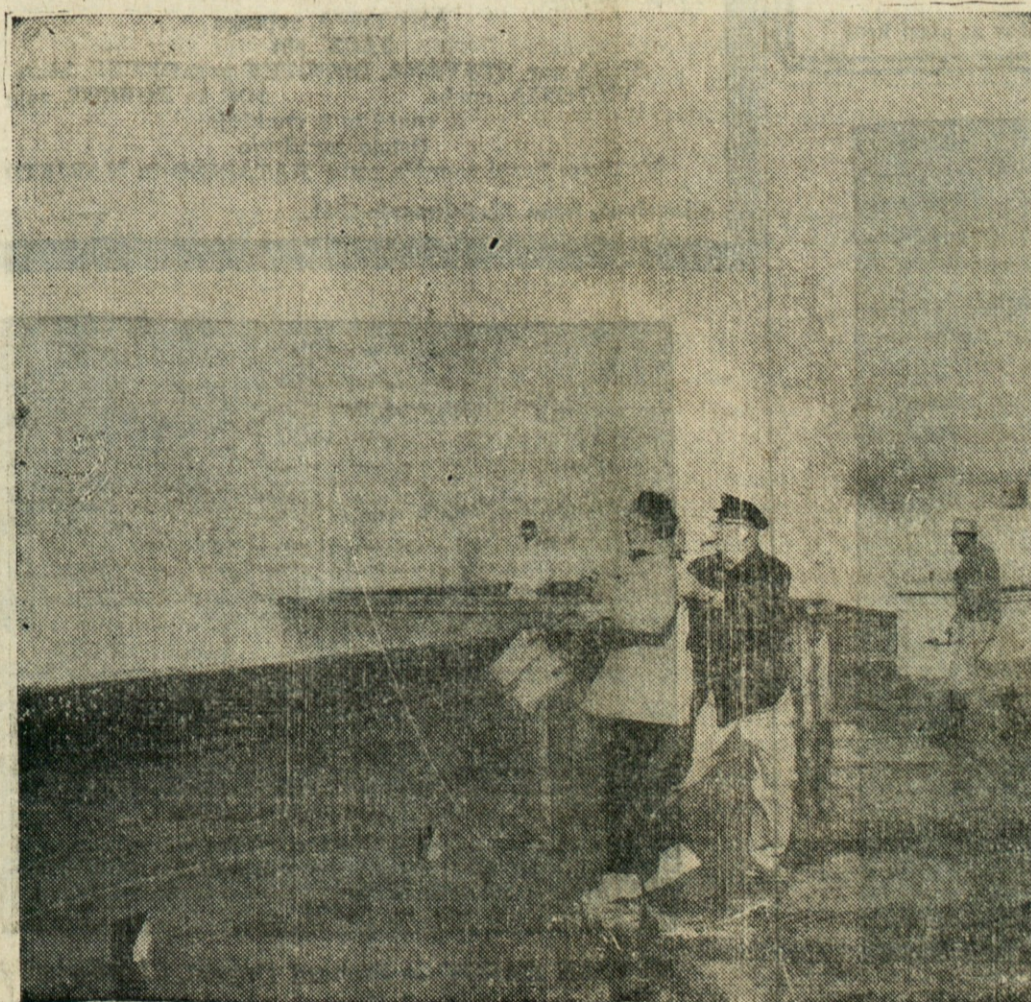
VIHARNO MORJE — šest in pol čevljev visoki valovi butajo preko zaščitnih zidov na bregu v San Francisco ter odkladajo tja pesek, ki ga delavca v ozadju mečeta nazaj v morje.