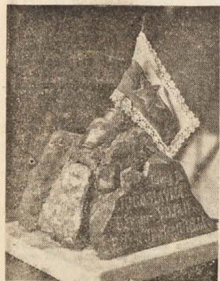
Vojkov memorial, ki ga je že drugič osvojila ekipa Gregorčiča

Vojsko, 7. marca. Danes in včeraj je bilo na prostranih terenih kraja Vojsko (1200 m), kjer so