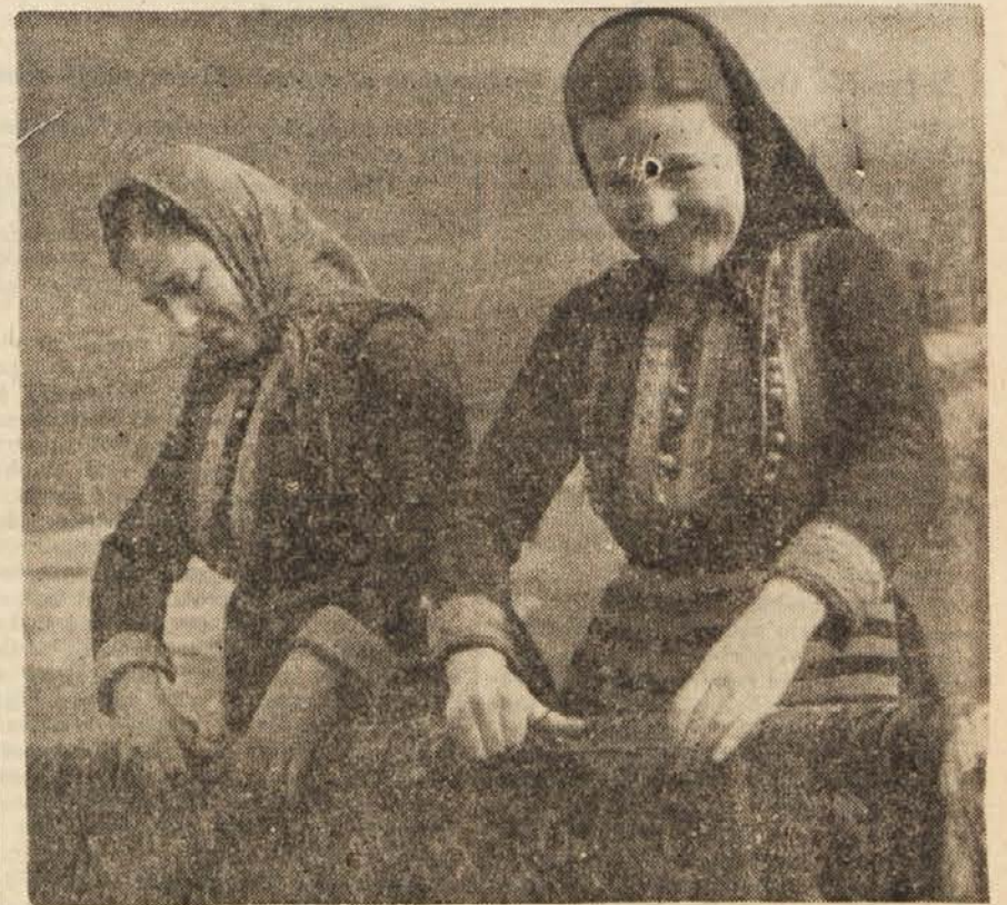
V Lazaropolju v Makedoniji se je okoli 200 družin po osvoboditvi združilo v zadrugo »Kosta Racin«. Zadrugarji se v glavnem bavijo s kmetijstvom, okrog 400 žena pa dela v preprogarskih brigadah.