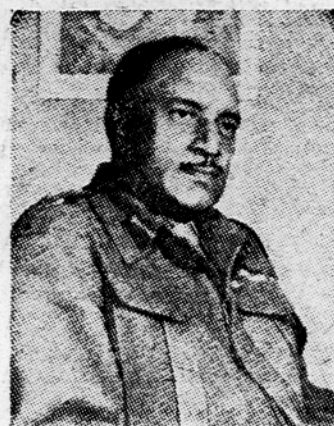
Indijski general K. S. Timaja, predsednik nevtalne komisije za repatriacijo korejskih ujetnikov

Severni so si izgovorili čas, da bodo proučili obtožbe