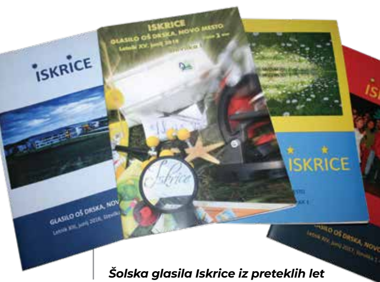
Šolska glasila Iskrice iz preteklih let

V prispevku bom predstavila, kako učenci v interesni dejavnosti igrivo spoznavajo vse novinarske zvrsti in delo v medijih ter se igrajo prave novinarje v pravem uredništvu. Ob tem razvijajo komunikacijske spretnosti, računalniške veščine in ustvarjalnost. Med letom učenci objavljajo prispevke na spletni strani šole in v šolski rubriki lokalnega časopisa, na koncu šolskega leta pa izdajo šolsko glasilo, se prelevijo v tržnike, za časopis pripravijo oglaševalsko akcijo in skrbijo za čim boljšo prodajo.