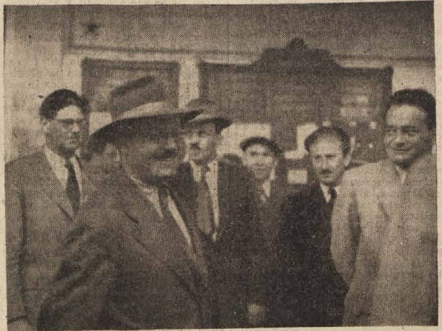
Tovariša Edvard Kardelj, Boris Kidrič in drugi predstavniki oblasti na kolodvoru v Ljubljani.