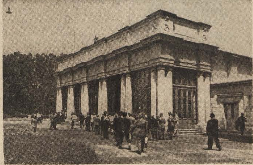
Pogled na zunanost poslopja, v katerem se vrši proces