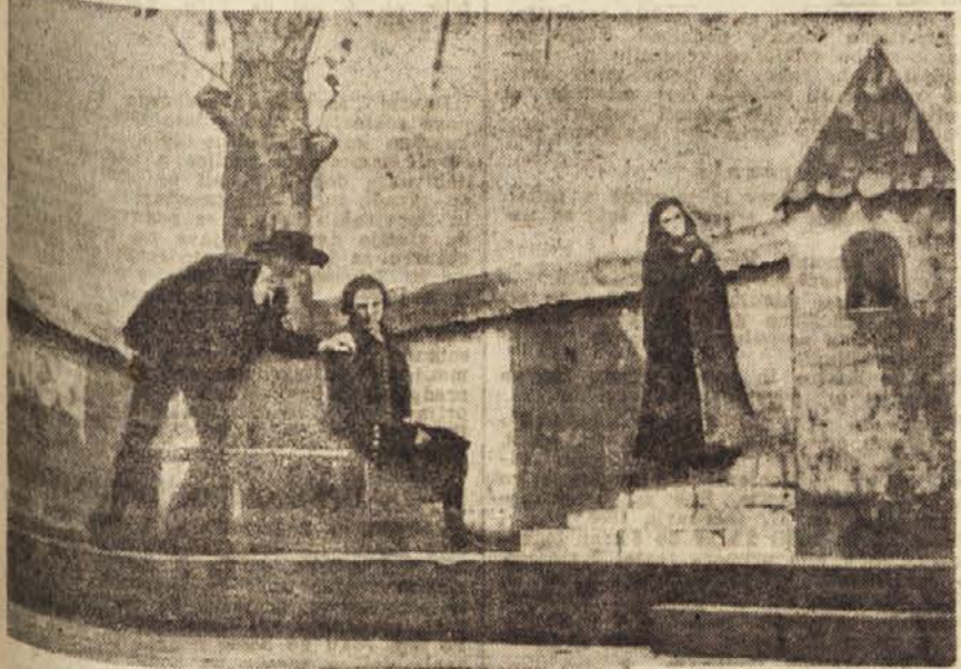
»Miklova Zala« v Rušah